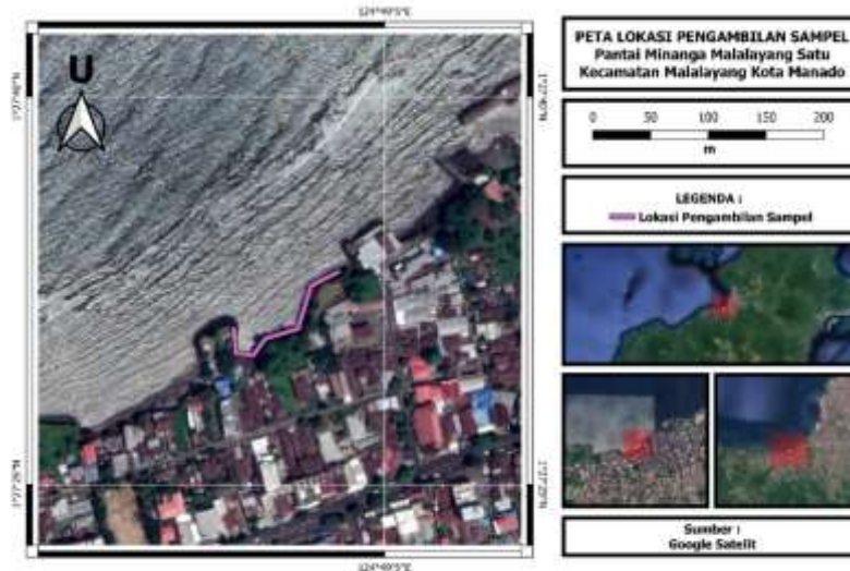
Gambar 1. Lokasi pengambilan sampel ditandai dengan garis berwarna ungu