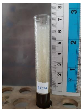
Gambar 3. Pengukuran Tinggi busa

Pengujian selanjutnya yaitu uji tinggi busa. Busa merupakan salah satu parameter yang paling penting dalam menentukan mutu produk-produk kosmetik, terutama sabun. Busa yang stabil dalam waktu lama lebih diinginkan karena busa dapat membantu membersihkan tubuh (Pradipto, 2009). Sabun dengan busa yang berlebih dapat menyebabkan iritasi kulit karena penggunaan bahan pembusa yang terlalu banyak. Menurut SNI (1996), tinggi busa sediaan sabun cair berkisar antara 13-220 mm. Dari hasil pengamatan tinggi busa sabun cair kombinasi ekstrak daun Jati dan daun Ekor Kucing berkisar 70-90 mm, dan basis sabun 62,33 yang berarti hasil tinggi busa yang dihasilkan sudah sesuai standar SNI. Karakteristik busa sabun dipengaruhi oleh beberapa faktor yaitu adanya bahan surfaktan, penstabil busa dan bahan-bahan penyusun sabun cair lainnya (Amin, 2010).