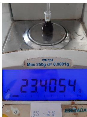
Gambar 4. Pengujian Bobot Jenis

Bobot jenis merupakan perbandingan relatif antara massa jenis suatu zat dengan massa jenis air murni pada volume dan suhu yang sama (SNI, 1996). Pengukuran bobot jenis bertujuan untuk menentukan mutu dan melihat kemurnian dari suatu senyawa, dalam hal ini khususnya sabun cair yang dihasilkan (Sari dan Ferdinan, 2017). Syarat bobot jenis sediaan sabun cair berdasarkan Standar Nasional Indonesia ialah 1,01-1,1 g/mL. Pengujian bobot jenis sediaan sabun cair dilakukan