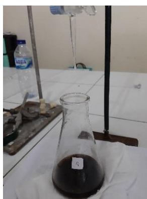
Gambar 6. Pengujian Kadar Alkali Bebas

Uji kadar alkali bebas merupakan uji terakhir yang dilakukan dalam evaluasi sediaan sabun cair kombinasi ekstrak daun Jati dan daun Ekor Kucing. Pengujian kadar alkali bebas bertujuan untuk melihat jumlah basa KOH yang tidak berikatan dengan asam lemak yang digunakan yaitu minyak zaitun. Standar Nasional Indonesia menetapkan maksimal kadar alkali bebas yang dihitung sebagai KOH ialah 0,14%. Berdasarkan hasil pengujian, diperoleh kadar alkali bebas sediaan sabun cair kombinasi ekstrak daun Jati dan daun Ekor Kucing dengan berbagai