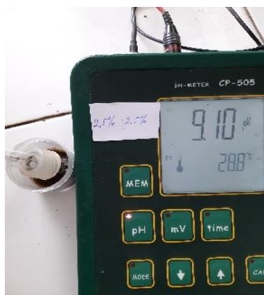
Gambar 2. Hasil Pengukuran pH

Pengujian pH bertujuan untuk melihat pH sediaan sabun cair kombinasi ekstrak daun Jati dan daun Ekor Kucing sesuai standar SNI. Nilai pH sediaan sabun cair sesuai syarat SNI berkisar antara 4-10 (SNI, 2017). Pengujian ini diperlukan untuk mencegah terjadinya iritasi kulit karena sabun cair akan bersentuhan langsung dengan kulit (Hernani et al. , 2010). Kulit manusia memiliki ketahanan terhadap asam atau basa pada kisaran pH tertentu. Berdasarkan hasil uji yang diperoleh, menunjukkan sediaan sabun cair kombinasi ekstrak daun Jati dan daun Ekor Kucing memiliki pH