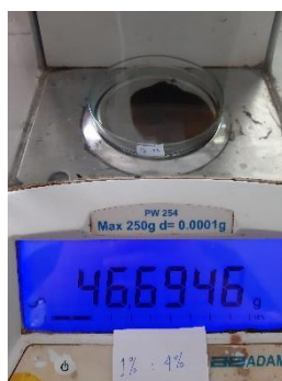
Gambar 5. Pengujian Kadar Air

Pengujian kadar air sediaan sabun cair kombinasi ekstrak daun Jati dan daun Ekor Kucing dilakukan untuk mengetahui banyaknya kandungan air yang terdapat pada sediaan sabun cair. Standar Nasional Indonesia menetapkan kadar air maksimum pada sediaan sabun cair ialah 60% (SNI, 1996). Kadar air yang didapatkan dari masing-masing sediaan yaitu untuk F0 64,32%, kadar air F1 47,47%, kadar air F2 43,29%, kadar air F3 46,49%, kadar air F4 48,14%, dan kadar air untuk F5 yaitu 47,85%. Berdasarkan hasil yang diperoleh menunjukkan bahwa semua sediaan sabun