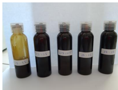
Gambar 1. Sediaan Sabun Cair

Formulasi sediaan sabun cair dibuat menggunakan zat aktif dari kombinasi ekstrak daun Jati dan daun Ekor Kucing. Proses formulasi sabun cair diawali dengan membuat basis sabun dari asam lemak dan basa kemudian ditambahkan bahan tambahan dan zat aktif secara bertahap (Dimpudus et al. , 2017). Hasil formulasi sabun cair didapatkan sabun cair dengan berbagai perbandingan konsentrasi kombinasi ekstrak daun Jati dan daun Ekor Kucing dan sabun cair tanpa penambahan ekstrak digunakan sebagai sediaan pembanding.