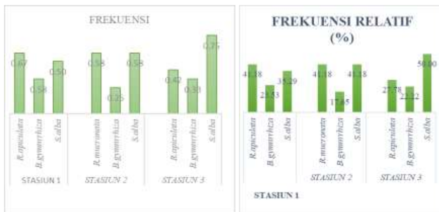
Gambar 3. Grafik Frekuensi dan frekuensi relatif