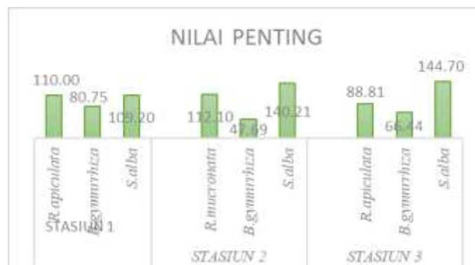
Gambar 5. Grafik INP