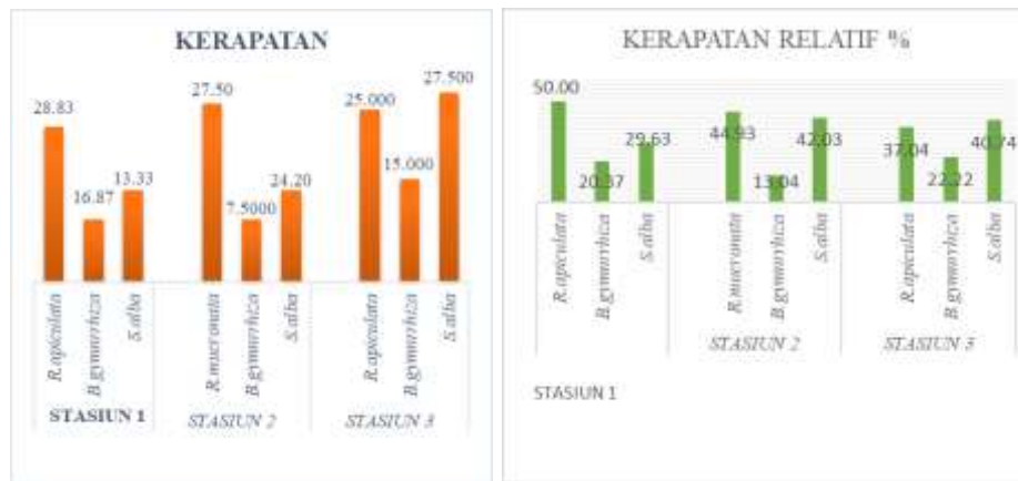
Gambar 2 .Grafik Kerapatan dan kerapatan relative