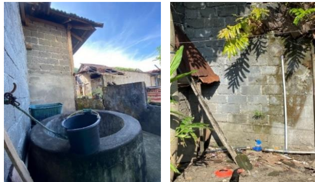
Gambar 6. Kondisi Penyediaan Air Minum Lokasi Penelitian (Penuli, 2022)

Faktor kondisi penyediaan air minum di kawasan kumuh perkotaan kecamatan Amurang, Amurang Timur dan Tumpaam memiliki total skor 56 dapat diartikan bahwa faktor ini memiliki skor tingkat pengaruh tinggi terhadap terjadinya tingkat kekumuhan.