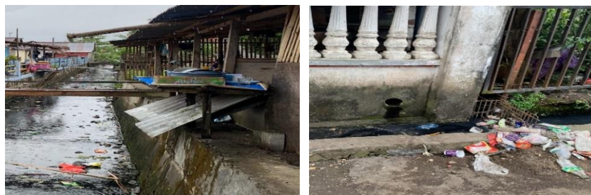
Gambar 5. Kondisi Drainase Lingkungan Kondisi Penelitian

Faktor kondisi pengelolaan persampahan di kawasan kumuh perkotaan kecamatan Amurang, Amurang Timur dan Tumpaan memiliki total skor 60 dapat diartikan bahwa faktor ini memiliki skor tingkat pengaruh tinggi terhadap terjadinya tingkat kekumuhan.