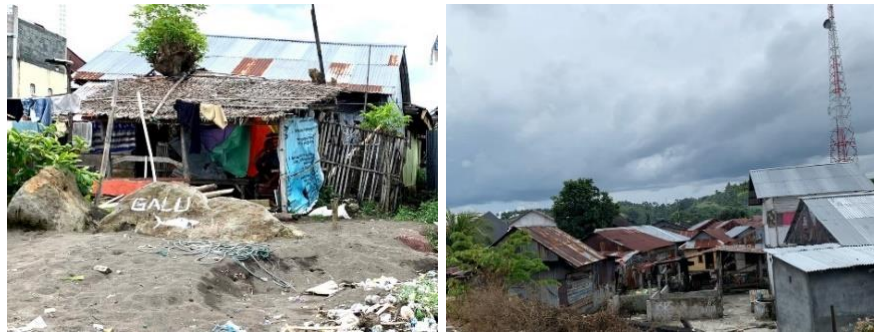
Gambar 2. Kondisi Bangunan Gedung Lokasi Penelitian