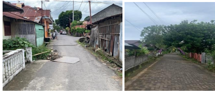
Gambar 3. Kondisi Jalan Lingkungan Lokasi Penelitian

Faktor kondisi jalan lingkungan di kawasan kumuh perkotaan kecamatan Amurang, Amurang Timur dan Tumpaam memiliki total skor 14 dapat diartikan bahwa faktor ini tidak memiliki skor tingkat pengaruh sedang terhadap terjadinya tingkat kekumuhan.