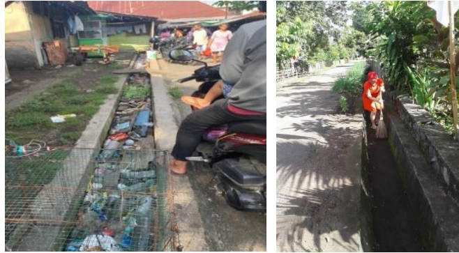
Gambar 4. Kondisi Drainase Lingkungan Lokasi Penelitian (Penulis, 2022)

Faktor kondisi drainase lingkungan di kawasan kumuh perkotaan kecamatan Amurang, Amurang Timur dan Tumpaan memiliki total skor 50 dapat diartikan bahwa faktor ini memiliki skor tingkat pengaruh tinggi terhadap terjadinya tingkat kekumuhan.