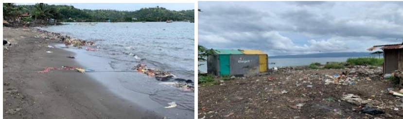
Gambar 7. Kondisi Pengelolaan Persampahan Lokasi Penelitian (Penulis, 2022)

Faktor kondisi pengelolaan persampahan di kawasan kumuh perkotaan kecamatan Amurang, Amurang Timur dan Tumpaan memiliki total skor 60 dapat diartikan bahwa faktor ini memiliki skor tingkat pengaruh tinggi terhadap terjadinya tingkat kekumuhan