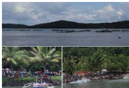
Gambar 6. Penonton MBG

Kegiatan lomba ini sangat diapresiasi masyarakat, dengan jumlah penonton yang banyak dalam menonton kegiatan lomba MBG ini, dan diharapkan akan terus menjadi daya tarik pariwisata di Desa Bentung Kecamatan Tabukan Selatan.