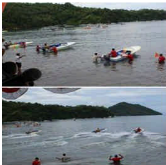
Gambar 4. Lomba Motor Speed Berkekuatan 40 PK

Lomba speed berkekuatan 40 PK, dengan jumlah peserta lima peserta menjadi lomba yang ditunggu-tunggu oleh para masyarakat atau para penonton. Lomba balap perahu ini memiliki rute terjauh dalam balapan dengan garis start dan finish dari pantai Mairokang Bentung. Rute jalur balapan perahu sejumlah kegiatan MBG dapat dilihat pada Gambar 5.