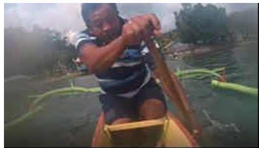
Gambar 2. Lomba Balap Perahu dayung MBG

Pembukaan kegiatan MBG II, dimulai pada tanggal 20 Oktober 2016 dan kegiatan tersebut dibuka secara langsung oleh Bupati Kabupaten Kepulauan Sangihe, dan selanjutnya dimulai dengan lomba balap 2 Orang Putri dengan jumlah peserta 8 peserta dan lanjut dengan Lomba Dayung Putra 1 dan 2 Orang dengan jumlah peserta 15 peserta Jarak Kegiatan 150 Meter ke arah laut dari pantai mairokang dan balik kepantai dengan jumlah keseluruhan jarak lomba dayung 300 Meter. Kegiatan lomba di hari pertama diselenggarakan hingga fase semi final dan untuk lomba final dilaksanakan di hari terakhir (26 Oktober 2016).