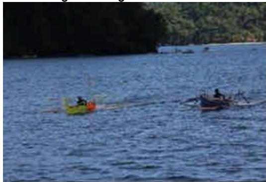
Gambar 3. Lomba Perahu Motor 5,5 PK

Laotongan sampai pantai Mairokang Bentung. Lomba speed berkekuatan 40 PK, dengan jumlah peserta 4 peserta menjadi lomba yang ditunggu-tunggu oleh para masyarakat atau para penonton. Lomba balap perahu ini memiliki rute terjauh berjarak 14,5 Km dalam balapan dengan garis start dan finish dari pantai Mairokang Bentung.