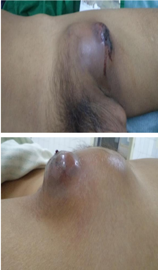
Gambar 1. Benjolan pada area inguinal kiri

nitrit negatif, protein positif, glukosa normal, keton negatif, urobilinogen negatif.