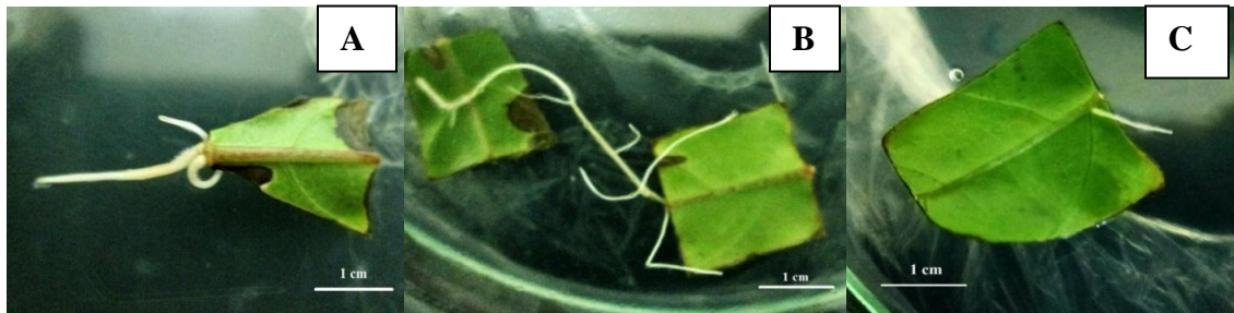
Gambar 1. Eksplan yang membentuk akar rambut yang diinfeksi A. rhizogenes strain YMB 072001 selama 40 menit (A), selama 50 menit (B), dan yang diinfeksi A. rhizogenes strain A4T selama 10 menit (C).