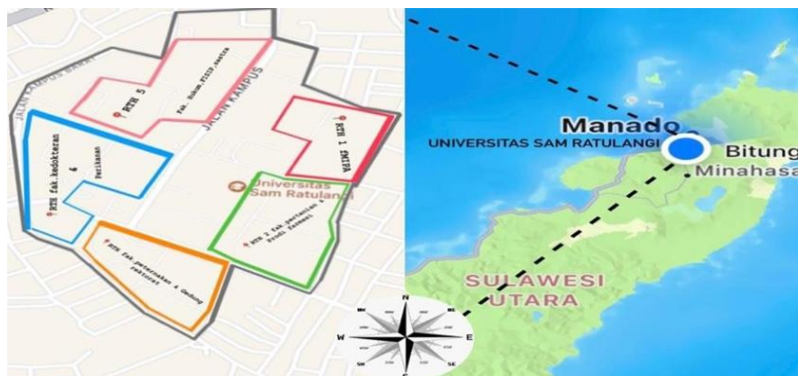
Gambar 1. Peta Lokasi okasi inventarisasi tumbuhan paku di Ruang Terbuka Hijau

Penelitian ini dilaksanakan di Ruang Terbuka Hijau Kampus Universitas Sam Ratulangi Manado, Sulawesi Utara. Lokasi penelitian di Ruang Terbuka Hijau Kampus Universitas Sam Ratulangi Kelurahan Bahu, Kecamatan Malalayang, Provinsi Sulawesi Utara Kota Manado. Dengan 5 titik lokasi yang diamati (Gambar 1) yaitu: RTH 1 Fakultas Matematika dan Ilmu Pengetahuan Alam, RTH 2 Fakultas Pertanian Prodi Farmasi, RTH 3 Fakultas Peternakan dan Gedung Rektorat, RTH 4 Fakultas Kedokteran dan Perikanan dan RTH 5 Fakultas Hukum, FISIP, Sastra (Gambar 1).