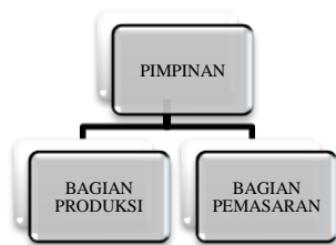
Gambar 1. Struktur organisasi usaha bubur jagung mutiara

Berdasarkan hasil penelitian, struktur organisasi usaha bubur jagung mutiara sangatlah sederhana. Berikut ini adalah struktur organisasi usaha bubur jagung mutiara pada Gambar 1.