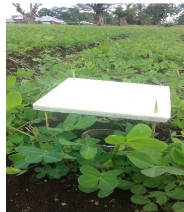
Gambar 2. Perangkap Jebak ( pitfall trap ) Yang Digunakan Untuk Pengambilan Sampel Laba-laba Pada Permukaan Tanah

sudut areal kebun masing-masing tipe habitat Gambar 3.