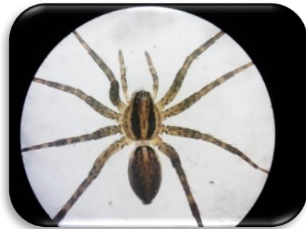
Gambar 4. Pardosa sp. yang di ambil melalui mikroskop.

Laba-laba Pardosa sp. dikenal dengan ciri-ciri gambaran seperti garpu pada punggung sefalotoraks dan gambaran berupa garis atau bercak berwarna putih pada abdomen. Betina dewasa panjang tubuhnya 9.95 mm, sefalotoraks panjang 4.75 mm, lebar 4.00 mm dan tebal 3.00 mm; abdomen panjang 5.20 mm, lebar 5.00 mm dan tebal 3.50 mm. Sefalotoraks berwarna kelabu coklat sampai kelabu gelap kecuali daerah mata, di bagian tengah terdapat gambaran berbentuk garpu dan pita submarginal. Jantan panjang tubuhnya 6.80 mm; sefalotoraks panjang 3.80 mm, lebar 3.00 mm dan tebal 1.80 mm; abdomen panjang 3.20 mm, lebar 1.80 mm, tebal 1.70 mm. Seperti pada betina, di bagian tengah dan tepi sefalotoraks terdapat pita yang jelas.