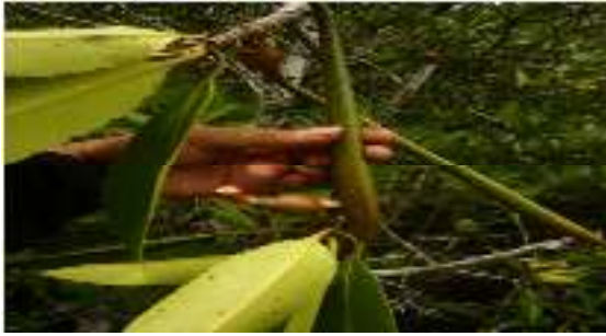
Gambar 14. Rhizophora apiculata

Perawakan : Pohon memiliki akar tunjang yang bercabang, bentuk batang silindris permukaan batang kasar dan pecah-pecah, kulit batang berwarna abu abu tua.