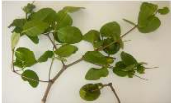
Gambar 16. Sonneratia ovata

Perawakan : Pohon bertumbuh tegak lurus, mempunyai permukaan batang sedikit halus berwarna coklat kehitaman, dengan memiliki akar nafas