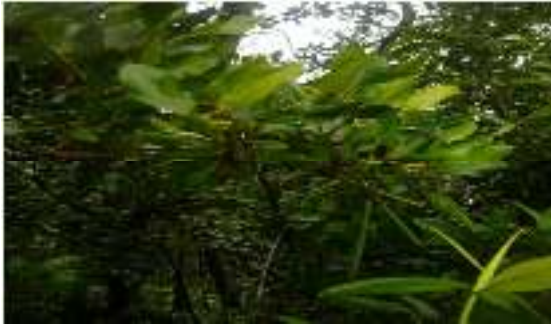
Gambar 10. Ceriops decandra

Kingdom : Plantae Phylum : Tracheophyta Class : Magnoliopsida Order : Rhizophorales Family : Rhizophoraceae