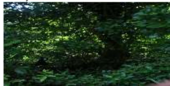
Gambar 18. Xylocarpus granatum

Perawakan : Pohon memiliki warna kulit batang berwarna merah kecoklat-coklatan mempunyai akar papan.