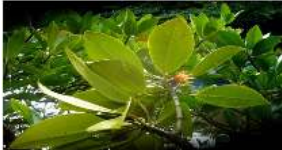
Gambar 7. Bruguiera gymnorizha

Kingdom : Plantae Phylum : Tracheophyta Class : Magnoliopsida Order : Rhizophorales Family : Rhizophoraceae