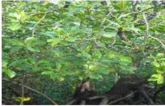
Gambar 12. Rhizophora stylosa

Perawakan : Pohon bertumbuh tegak lurus memiliki kulit batang berwarna coklat gelap hampir berwarna kehitaman, bentuk batan silindris. Pohon memiliki akar tunjang, memiliki retak-retak vertikal pada permukaan batang.