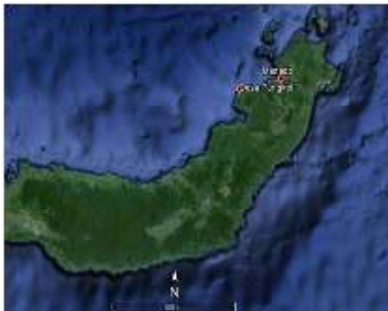
Gambar 1. Peta Lokasi Penelitian di Desa Pungkol

Penelitian dilaksanakan di Desa Pungkol Kecamatan Tatapaan, Kabupaten Minahasa Selatan Provinsi Sulawesi Utara ( gambar 1 ) selama 2 bulan yaitu pada bulan Agustus sampai September 2016 . Hutan mangrove Desa Pungkol merupakan bagian dari hutan Taman Nasional Bunaken.