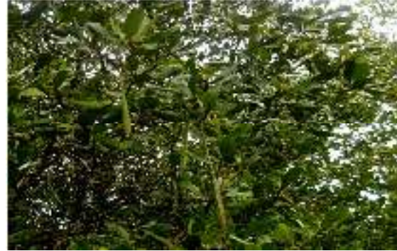
Gambar 11. Ceriops tagal

Kingdom : Plantae Phylum : Tracheophyta Class : Magnoliopsida Order : Rhizophorales Family : Rhizophoraceae