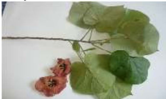
Gambar 17. Thespesia populnea

Perawakan : Warna batang coklat kehitaman sedikit kasar pada permukaan batang.