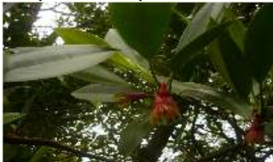
Gambar 8. Bruguiera sexangula

Kingdom : Plantae Phylum : Tracheophyta Class : Magnoliopsida Order : Rhizophorales Family : Rhizophoraceae