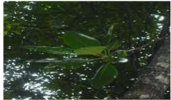
Gambar 13. Rhizophora mucronata

Kingdom : Plantea Phylum : Tracheophyta Class : Magnoliopsida Order : Rhizophorales Family : Rhizophoraceae