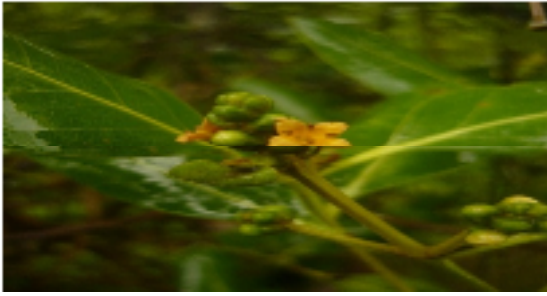
Gambar 4. Avicennia marina

Perawakan : Pohon tumbuh dengan warna hijau-abu, terkelupas, memiliki akar napas yang aberbentuk seperti pensil.