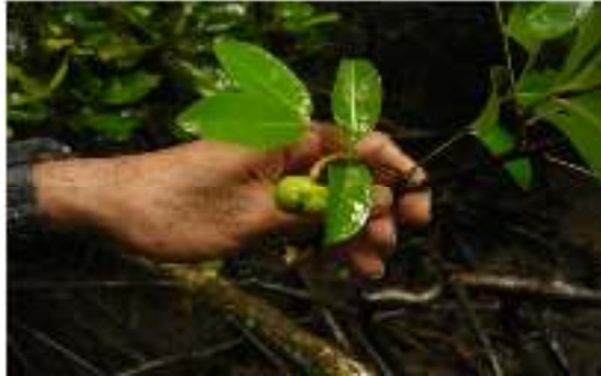
Gambar 19. Xylocarpus moluccensis

Perawakan : Pohon memiliki permukaan kulit batang pecah-pecah bewarna coklat abu-abu, pohon memiliki akar nafas dan juga akar papan.