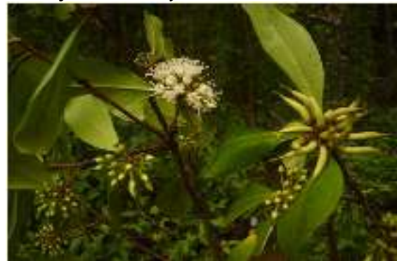
Gambar 6. Aigeceras floridum

Kingdom : Plantea Phylum : Tracheophyta Class : Magnoliopsida Order : Primulales Family : Myrsinaceae