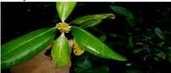
Gambar 5. Avicennia rumphiana

Kingdom : Plantea Phylum : Tracheophyta Class : Magnoliopsida Order : Lamiales Family : Avicenniaceae