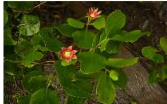
Gambar 15. Sonneratia alba

Perawakan : Pohon bertumbuh tegak lurus, memiliki batang berwarna coklat dengan celah longitudinal, mempunyai akar napas.