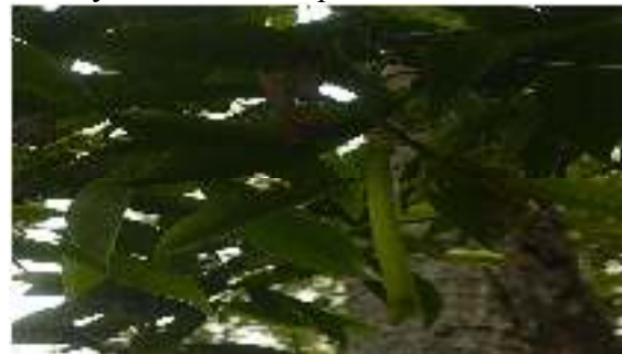
Gambar 9. Bruguiera parviflora

Kingdom : Plantae Phylum : Tracheophyta Class : Magnoliopsida Order : Rhizophorales Family : Rhizophoraceae