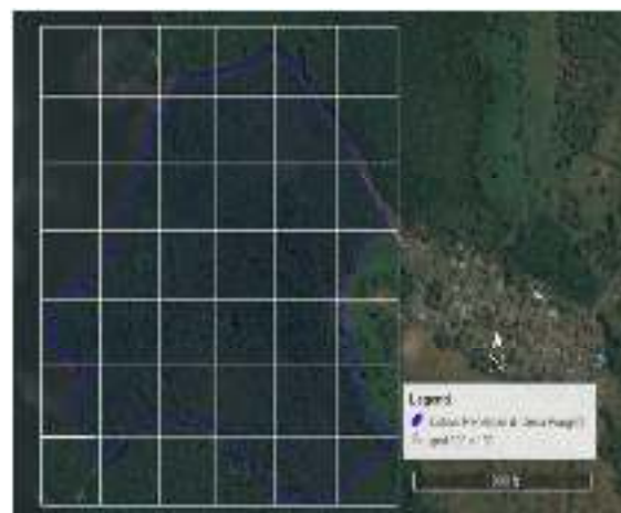
Gambar 2. Lokasi Penelitian

Metode yang akan digunakan dalam kegiatan penelitian ini menggunakan metode sensus yaitu dengan mengamati setiap individu mangrove yang ditemukan di seluruh kawasan, luas kawasan 25 ha akan dibuat grid bantuan 100 x 100 m (gambar 2 ) untuk memastikan bahwa seluruh kawasan telah teramati.