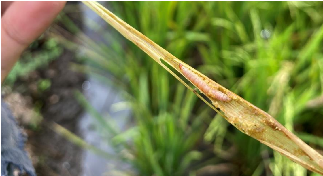
Gambar 3. Larva Penggerek Batang Padi Di Desa Liwutung II

Berdasarkan Gambar 3. Dapat diuraikan bahwa Larva penggerek batang padi kuning instar 1 segera menyebar setelah menetas, mencari anakan tanaman padi dan segera masuk ke batang tanaman dan larva penggerek batang padi kuning memakan bagian dalam batang padi. Larva sulit dikendalikan karena terlindungi dari musuh alami dan insektisida (Bandong and Litsinger 2005), sehingga hama ini sering menimbulkan kegagalan panen. Dilokasi penelitian larva ini menyerang tanaman padi pada umur tanaman \pm 80 Hari setelah tanam (Hst).