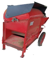
Gambar 1. Mesin perontok kedelai tipe MPT001

Mesin yang digunakan merupakan produksi tahun 2020 (Gambar 7) yang dimensinya berbeda (lebih kecil) dengan mesin yang produksi tahun 2015 yang diuji di Laboratorium Pascapanen Universitas Gajah Mada. Dimensi pada mesin ini diukur oleh peneliti. Dimensi yang diproduksi tahun 2015 adalah Panjang 160 cm, lebar 118,5 cm dan tinggi 139,6 cm.