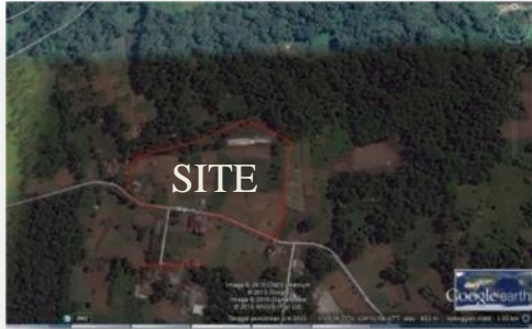
Gambar 3.1 Site

Site berada di Kecamatan Tomohon Utara, Jalan Lingkar Timur Kelurahan Matani. Sesuai dengan peruntukan lahan Kota Tomohon tahun 2006-2016 yaitu daerah ini merupakan kawasan budidaya..