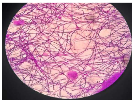
Gambar 1. Spermatozoa wistar kontrol

Rata-rata persentase morfologi spermatozoa normal kelompok perlakuan adalah 11%, sedangkan persentase morfologi spermatozoa normal kelompok kontrol adalah 97%. Sehingga didapatkan hasil bahwa morfologi spermatozoa kelompok perlakuan mengalami penurunan jika dibandingkan dengan kelompok kontrol.