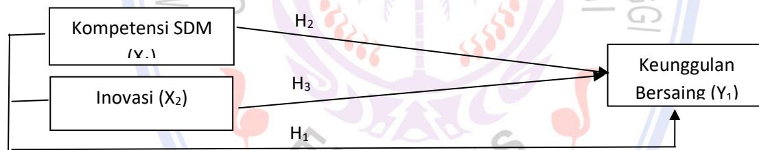
Gambar 1 Model Penelitian

Dalam Gambar 1 menunjukkan bahwa terdapat variabel yaitu variabel keputusan pembelian Berikut ini adalah kerangka pemikiran dalam penelitian ini: