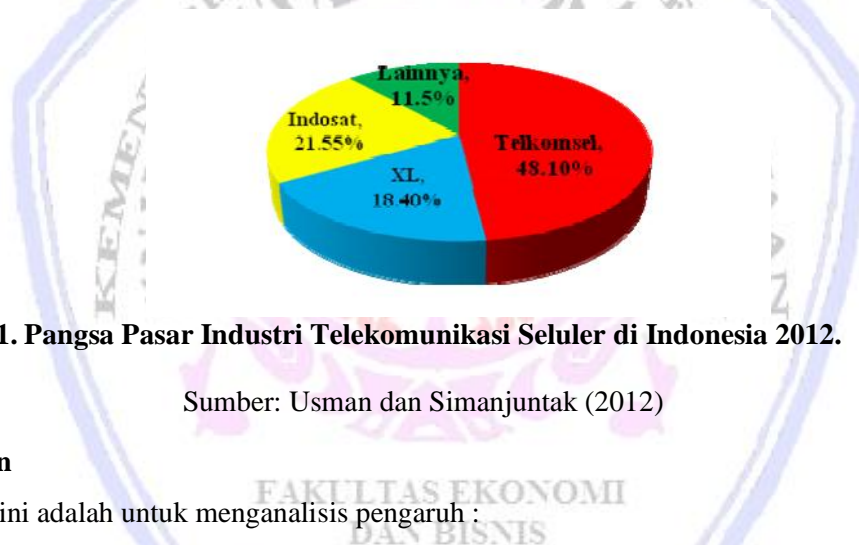
Gambar 1. Pangsa Pasar Industri Telekomunikasi Seluler di Indonesia 2012.

Sekarang ini persaingan produk GSM semakin ketat dikarenakan mulai bermunculan perusahaan telekomunikasi baru di Indonesia dan dengan memunculkan produk yang beraneka ragam dengan teknologi yang sama seperti Tri dari PT. Hutchinson Charoen Pokphand Telecom dan XL dari PT. XL Axiata Tbk. Maka, masalah yang timbul tersebut bisa menjadikan suatu peringatan mengenai eksistensi produk Telkomsel khususnya kartu perdana Simpati. Sebanyak 6 operator tercatat sebagai pemain aktif di Indonesia. Namun, pangsa pasar industri telekomunikasi seluler tahun 2012 hanya didominasi oleh 3 pemain besar yaitu Telkomsel, Indosat, dan XL masing-masing sebesar 48.10%, 21.55%, dan 18.40% (Usman dan Simanjuntak 2012).