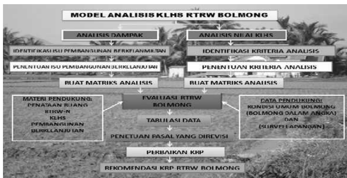
Gambar 2. Formulasi Model Analisis KLHS RTRW Kabupaten Bolmong (Figure 2. Spatial Analysis Model Formulation KLHS Bolmong District)

Kebijakan yang terkait dengan asas keterkaitan, keseimbangan, dan keadilan sangat perlu untuk direvisi, sehingga dapat menjamin pembangunan berkelanjutan di Kabupaten Bolaang Mongondow.