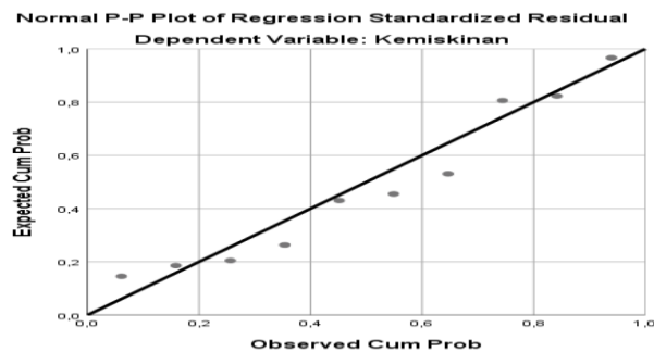
Tabel 11. Hasil Uji Normalitas Pertumbuhan Ekonomi Terhadap Kesempatan Kerja di Kabupaten Merauke