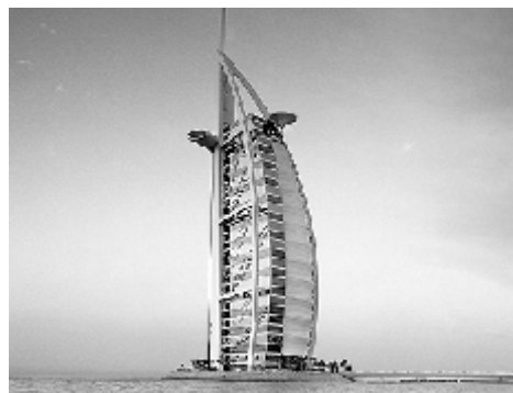
Gambar 2 Burtj Al Arab, Dubai

Bagaimana dengan pembobotan masing-masing kriteria untuk bangunan yang berbeda-beda? Adalah pertanyaan yang timbul jika penilaian terhadap arsitektur menggunakan teori dari Vitruvius. Sebagai contoh, yang dapat dilihat pada gambar-gambar di bawah ini, dimana setiap bangunan memiliki pesona keindahan masing-masing. Manakah dari keempat bangunan ini yang paling indah?