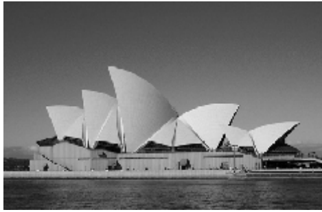
Gambar 3 Sidney Opera House, Australia