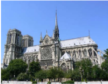
Gambar 7 Gereja Katedral Notre Dame, Paris,