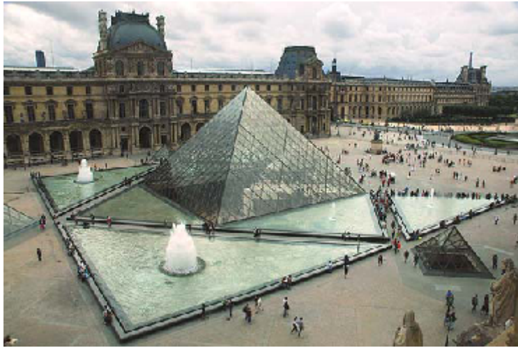
Gambar 9 Museum Louvre, Paris

Arsitek IM Pei dengan karyanya, Museum Louvre, Paris (Gambar 2). Museum Louvre yang berada di Paris ini jika ditinjau dari segi bentuk akan tampak biasa-biasa saja, berupa piramid kaca, tidak ada yang spesial. Namun unggul karena konsepnya yaitu both-end (ada namun tidak ada), dapat membuat banyak para arsitek kagum.. Ketika diberi tugas untuk membuat museum ini, IM Pei berpikir bahwa tidak mungkin menandingi kebesaran Istana Louvre. Oleh karena itu dibuatlah bangunan yang terbenam, masuk dalam tanah, dan sebagai tandanya, dibuatlah juga piramid kaca di bagian atas. Sengaja dipilih kaca agar transparan, tembus pandang, agar tidak “menggangu” keberadaan Istana Louvre. Dua karya yang dibangun pada zaman yang berbeda dapat bersanding selaras dalam penampilan yang kontras yang merupakan suatu pemecahan yang cerdas dalam mengatasi permasalahan yang ada.