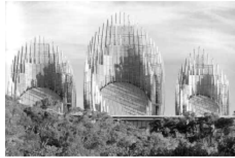
Gambar 4 Tjibaou Cultural Centre, New Caledonia

Bangunan berlantai banyak ( high rise building ) pada Burtj Al Arab (gambar 2), kriteria utamanya penekanan pada kekokohan, dimana karakter teknologi bangunan tinggi lebih dikedepankan. Sidney Opera House (gambar 3), kriteria utamanya penekanan pada kekokohan, dimana teknologi bangunan bentang lebar lebih di kedepankan. Tjibaou Cultural Centre (gambar 4), kriteria utamanya penekanan pada estetika pengolahan bentuk.