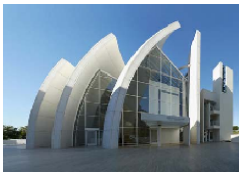
Gambar 5 Gereja Trinitas, karya Robert Venturi

Uraian diatas, dapat dijadikan landasan dalam menentukan nilai lebih sebuah arsitektur untuk bangunan dengan fungsi yang berbeda. Akan tetapi masih ada permasalahan yang lain, yaitu bagaimana kita menentukan nilai lebih dari bangunan-bangunan yang sejenis, misalnya bangunan gereja yang satu dengan bangunan gereja yang lain seperti yang terlihat pada gambar 5 s/d Gambar 8 di bawah ini.