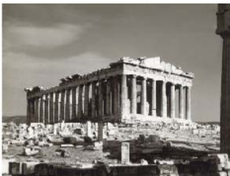
Gambar 1 Parthenon, Yunani

Tepat atau tidak suatu suatu penilaian terhadap arsitektur harus menggunakan kaca mata yang tepat untuk dapat mendudukan karya tersebut dalam bingkai penilaian yang sesuai. Pertama yang harus diketahui adalah sejarah terbentuknya karya arsitektur tersebut, kemajuan ilmu pengetahuan pada waktu itu, serta konsep-konsep sang perancang. Sebagai contoh :