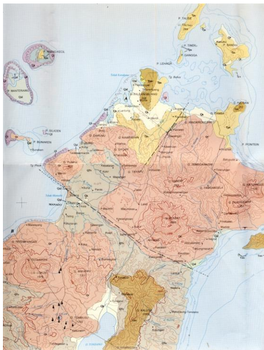
Gambar 1. Patahan Manado di wilayah Sulawesi Utara (Effendi dan Bawono, 1997).

Patahan Manado yang melintasi wilayah Kotamadya Manado menurut Peta Geologi lembar Manado (Gamabar 1) diperkirakan berada pada lokasi tepat di bawah kota Manado-Ketang-Sorengsong-Paslaten-Karegesan-Tontalete pada satu garis lurus (Effendi dan Bawono, 1997).