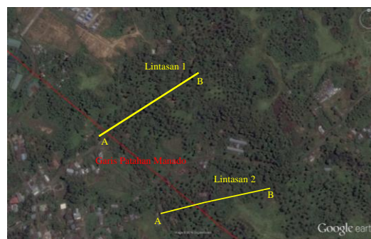
Gambar 2. Peta Lintasan akuisisi data pada lokasi penelitian

Akuisisi data di lokasi penelitian dilaksanakan pada dua lintasan, Lintasan 1 dan Lintasan 2 dengan posisi lintasan tampak pada Gambar 2.