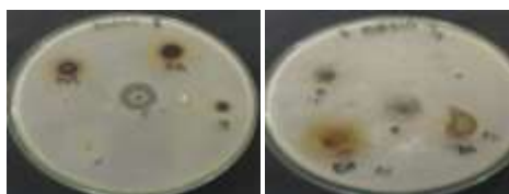
Gambar 1.(a) Staphylococcus aureus , (b) Escherichia coli Tabel 4. Hasil Pengukuran Rata - Rata Diameter Zona Hambat Ekstrak n-Heksan, Etil Asetat, dan Methanol dari Daun Kaf ( Chisocheton sp. (C.DC). Harms ) Terhadap Pertumbuhan Bakteri Staphylococcus aureus dan Escherichiacoli , selama 1 jam.