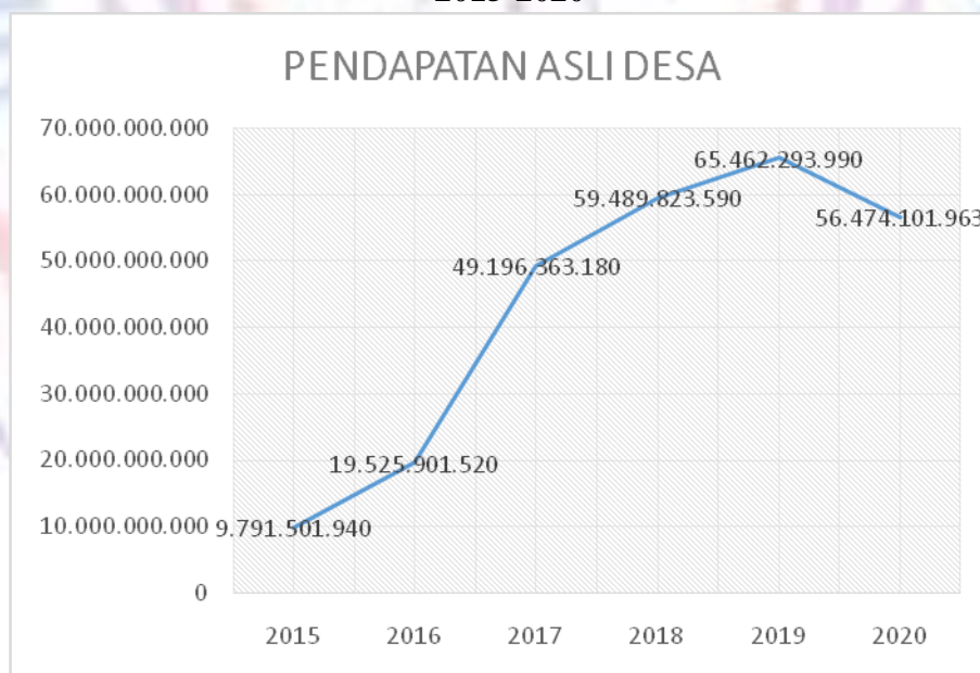
Tabel 1.1 Perkembangan Pendapatan Asli Desa Kabupaten Minahasa Tenggara tahun 2015-2020

Sumber: Dinas Pemberdayaan Masyarakat Desa (PMD) Kabupaten Minahasa Tenggara tahun 2022