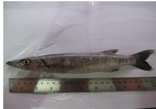
Gambar 10. Barracuda.

cm. Jumlah yang tercatat ditemukan di Indonesia 7 jenis ikan.