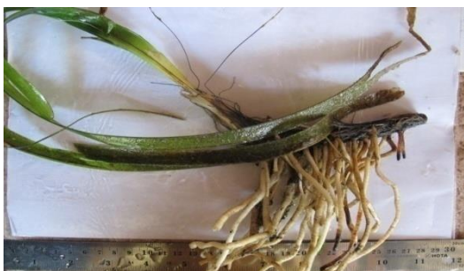
Gambar 11. E. acroides .

mengapung di permukaan air kemudian tersebar mengikuti arah arus air laut dan selanjutnya tenggelam secara perlahan-lahan untuk membuahi bunga betina. Buah berbentuk seperti telur dan mempunyai 12 biji.