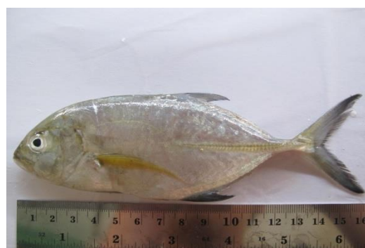
Gambar 1. Bobara.

lepas). Alat tangkap yang paling dominan adalah Purse Seine dan Gill Net (sebagian kecil). Untuk jenis ikan Kuwe yang terdapat di terumbu karang, alat tangkap paling dominan adalah Pancing dan jaring Muro Ami. Di Indonesia, produksi ikan Kuwe terutama dijual segar dan untuk pindang. Ukuran yang tertangkap sangat beragam, tergantung dari spesiesnya. Jenis perikanan ini sangat penting bagi nelayan untuk pasar lokal dan domestik. Jumlah yang tercatat ditemukan di Indonesia 36 jenis ikan.