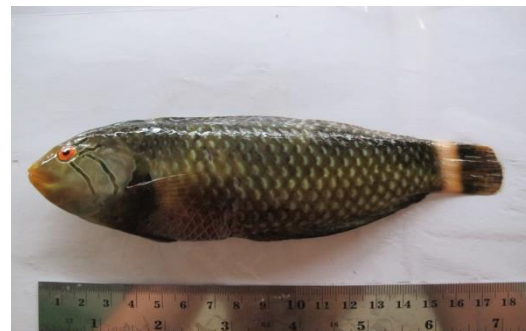
Gambar 8. Novaculichthys taeniourus .

abu-abu dengan garis coklat tua yang tidak teratur dari mata, 2 bercak hitam di bagian depan sirip punggung, pita/garis putih tegak yang lebar di dasar sirip ekor, bagian belakang sirip ekor hitam, sirip perut hitam. Ikan-ikan muda bercorng dan berwarna coklat, kemerahan, atau hijau, dengan bercak putih. Ikan jenis ini dapat mencapai panjang 30 cm. Ikan-ikan muda menyerupai rumput laut yang hanyut. Distribusi ikan ini di Indo-Pasifik.