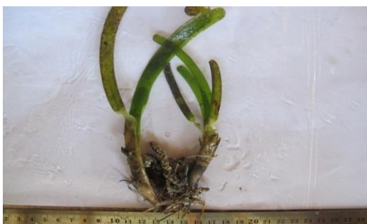
Gambar 12. T. hemprichii .

T. Hemprichii memiliki daun lurus sedikit melengkung, tepi daun tidak menonjol, panjang 5–20 cm, lebar mencapai 1 cm. Seludang daun tampak nyata dan keras dengan panjang berkisar antara 3–6 cm. Rimpang keras, menjalar, ruas-ruas rimpang mempunyai seludang.