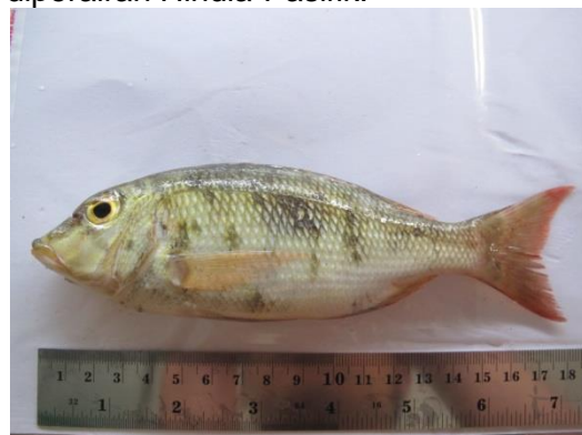
Gambar 6. Lethrinus species .

Ikan lecam Lethrinus spp merupakan ikan demersal kecil yang banyak tersebar di seluruh Indonesia. Ikan lecam Lethrinus spp merupakan ikan laut komoditas penting. Ikan lecam dapat diolah dan digunakan sebagai ikan asin, ikan kering, baso ikan, tempura ikan, dan lain-lain. Pemanfaatan ikan lecam sebagai olahan makanan di Indonesia telah mencapai tingkat ekspor. Tangkapan ikan Lencam di Indonesia terdapat hampir di seluruh pelabuhan perikanan di Indonesia. Sampai saat ini Ikan Lencam belum dinyatakan sebagai spesies yang terancam keberadaannya karena spesies ini tersebar hampir diperairan Hindia-Pasifik.