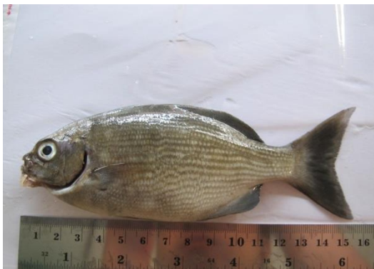
Gambar 3. Chubs Fish.

Ciri-ciri ikan ini memiliki panjang maksimal 75 cm, badan abu-abu keperakan kadang ada juga yang kuning dan putih albino. Garis yang terbentuk antara sirip ekor dan sirip anal lebih tegak dibandingkan K. vaigiensis . Habitat di daerah terbuka di lereng karang dan kadang di daerah dangkal dan karang berbatu. Range kedalaman 1-25 m. Distribusi ikan ini Indo-Pasifik, Merah, Timur Afrika, timur dan barat Australia, Kepulauan Lord Howe dan rapa dan Jepang. Ikan ini tipe pemakan Bentik alga, ( Sargassum dan Turbinaria ) bentik krustacea, cacing.