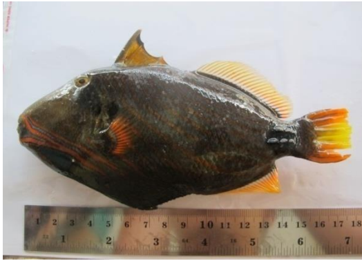
Gambar 2. Trigger Fish.