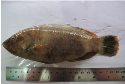
Gambar 9. Cheilinus trilobatus .

10. Barracuda fish, Ikan barracuda ( Sphyraenidae ).