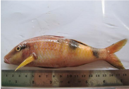
Gambar 5. Ikan biji nangka.

juga sering menangkap ikan ini dengan alat Jaring Tarik. Ikan ini sebenarnya bisa mencapai ukuran 60 cm, namun lebih sering tertangkap pada panjang sekitar 30 cm. Jumlah spesies yang ditemukan di wilayah Pasifik Barat mencapai 29 jenis, semuanya tercatat ditemukan di Indonesia. Jumlah yang tercatat ditemukan di Indonesia mencapai 29 jenis.