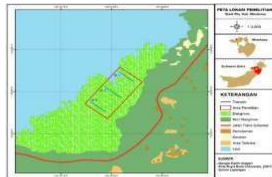
Gambar 1. Peta Lokasi Kerja Penelitian

Pengambilan sampel dilaksanakan di Pantai Tasik Ria, Kecamatan Tombariri, Kabupaten Minahasa (Gambar 1). Waktu kerja penelitian untuk pengambilan data di laksanakan 1 hari, diawali dengan survei lokasi, pengambilan data dan penulisan sehingga pada tahap penyusunan skripsi selama kurang lebih 3 bulan