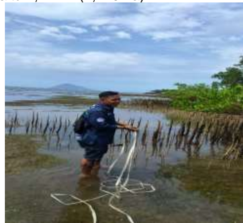
Gambar 3 : lokasi penelitian Identifikasi Sampah Anorganik di Pantai Tasik Ria

Penelitian sampah anorganik dilakukan di ekosistem mangrove Pantai Tasik Ria, Kecamatan Tombariri, Kabupaten Minahasa, Sulawesi Utara. Lokasi ini merupakan daerah yang berhadapan langsung dengan laut dapat dilihat pada Gambar 3. Luas wilayah Tempat Penelitian (ekosistem mangrove) yaitu 7,72 m 2 (7,720 ha)