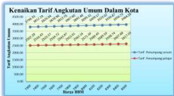
Gambar 2. Hubungan Antara Kenaikan Harga BBM dan Tarif Angkutan Umum

Dari hasil perhitungan, sebagaimana terlihat pada Tabel 4.14, kenaikan harga BBM sebesar 1,37 % mengakibatkan kenaikan tarif angkutan umum dalam kota yaitu trayek pusat kota – malalayang sebesar 0,36.