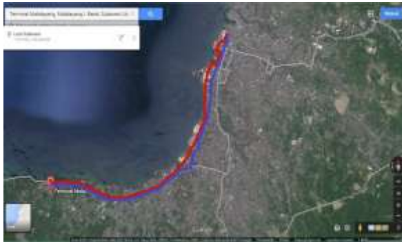
Gambar 1. Jalur trayek Malalayang – pusat kota

data secara detail dari dinas perhubungan kota manado mengenai koperasi atau badan usaha di trayek ini.