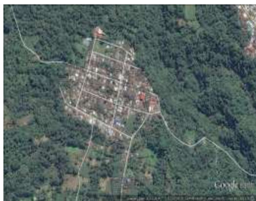
Gambar 1 Lokasi Penelitian

Perencanaan sistem penyediaan air bersih dilakukan di Desa Ranolambot Kecamatan Kawangkoan Barat Kabupaten Minahasa.