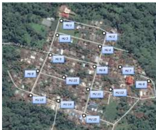
Gambar 2. Penempatan Hidran Umum di Desa Ranolambot

Penempatan Hidran Umum di desa adalah sebagai berikut :