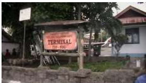
Gambar 1: Terminal Ulu Siau saat ini