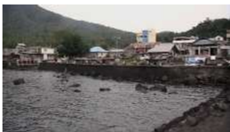
Gambar 2 : Lokasi Pembangunan Terminal Ulu yang baru