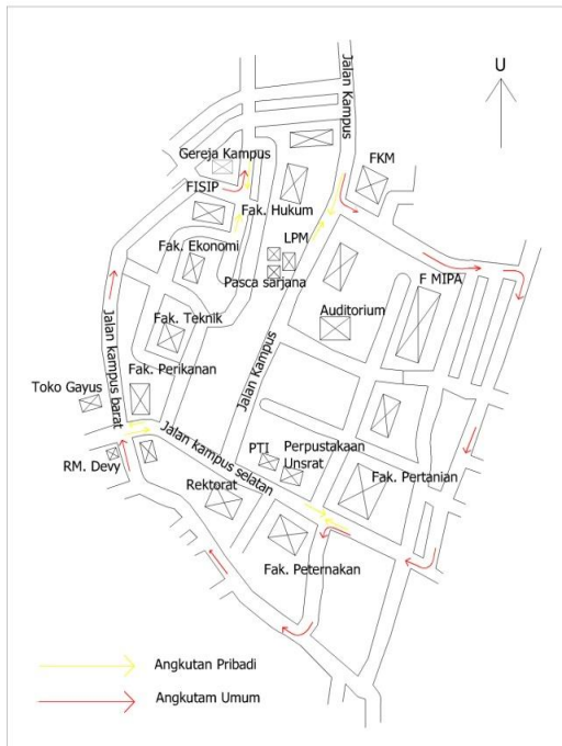
Gambar 2. Sketsa Jaringan jalan dan Jalur Kendaran Kampus UNSRAT