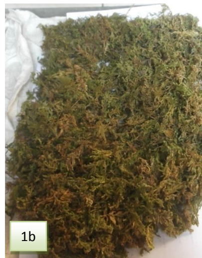
Gambar 1. Sampel S. delicatula yang ditimbang berat basah (1a) dan berat kering (1b).