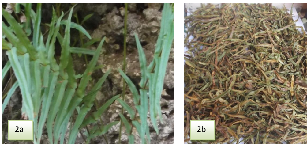
Gambar 2. Sampel P. vittata yang ditimbang berat basah (2a) dan berat kering (2b).

Perendaman sampel dalam pelarut mengakibatkan dinding sel daun sampel S. delicatula dan P. vittata keluar dan terlarut dalam pelarut yang digunakan (Haryadi, 2012). Sampel yang telah direndam kemudian disaring dan menghasilkan