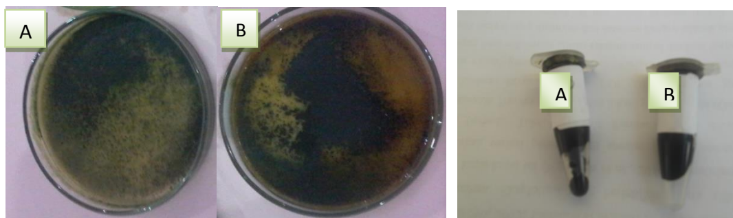
Gambar 3. Ekstrak kering hasil Evaporasi S. delicatula (A) dan P. vittata (B)

ekstrak cair dan dievaporasi sehingga diperoleh ekstrak kering (Gambar 3). Hasil ekstraksi selanjutnya diuji sitotoksitasnya terhadap sel kanker Leukemia p388 secara in vitro .