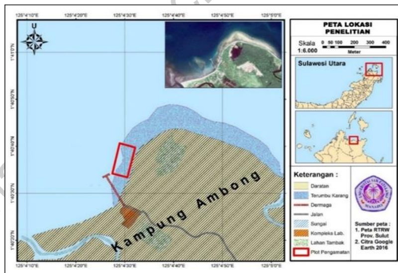
Gambar 1. Lokasi Pengambilan Sampel

Penelitian dilakukan pada rataan terumbu perairan Desa Likupang Kampung Ambong, Minahasa Utara yang terletak pada 1^{\circ}40'34,414'' sampai 1^{\circ}40'39,721'' LU dan 125^{\circ}4'27,653'' sampai 125^{\circ}4'32,17'' BT untuk penelitian distribusi karang Favia dan pengambilan spesimen karang Favia , sedangkan proses identifikasi karang genus Favia dilaksanakan di Program Studi Manajemen Sumber Daya Perairan FPIK UNSRAT. Penelitian dilaksanakan pada bulan Agustus dan berakhir pada Desember 2018.