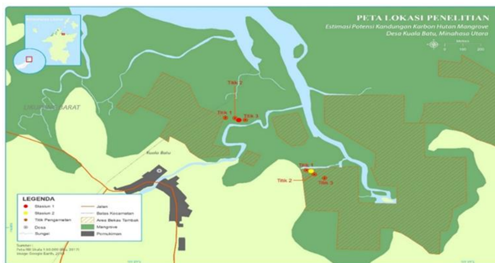
Gambar 1. Lokasi penelitian

Penelitian ini dilakukan selama ± 2 bulan, dimulai dari bulan November – Desember 2019, di hutan mangrove Desa Sarawet (Dusun Kuala Batu), Kecamatan Likupang Timur, Kabupaten Minahasa Utara. Desa Sarawet (Dusun Kuala Batu), memiliki hutan mangrove dengan luas ± 138 ha.