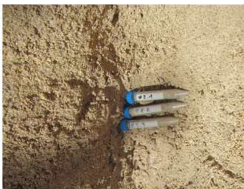
Gambar 2. Sampel sedimen

Berdasarkan hasil visualisasi elektroforesis DNA bakteri pada sedimen terlihat adanya pita DNA. Hal ini menunjukkan bahwa DNA bakteri tanpa kultivasi berhasil diisolasi dari sampel sedimen tersebut. Posisi pita yang sama terdapat pada hasil isolasi DNA bakteri kultur sebagai kontrol positif. Oleh sebab itu, sampel hasil isolasi DNA dianalisis lebih lanjut untuk diamplifikasi dan penentuan jenis bakteri dengan menggunakan Next Generation Sequencing (NGS).