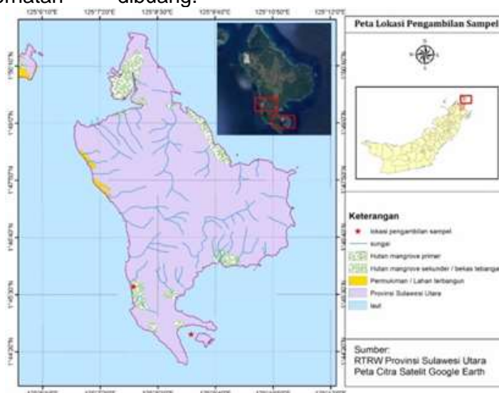
Gambar 1. Peta Lokasi Pengambilan Sampel di Pulau Bangka, Sulawesi Utara

Memasukkan 500 µl air laut yang telah difilter pada masing-masing tube . Dicampurkan dan dijadikan 1 tube selanjutnya disentrifugasi kembali dengan kecepatan 2000 rpm selama 15 menit. Supernatan dibuang dan pellet dipreparasi selanjutnya menggunakan prosedur dari DNeasy® PowerSoil Kit Hanbook (2018) untuk isolasi DNA bakteri.