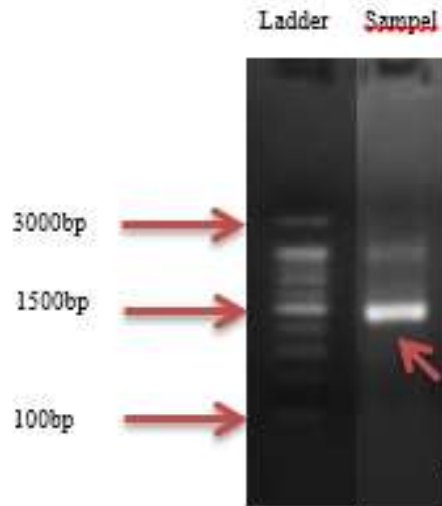
Gambar 4. Hasil amplifikasi DNA.

29.10°C. Selain Proteobacteria , Actinobacteria memiliki kelimpahan yang cukup tinggi. Actinobacteria adalah bakteri Gram-positif dan merupakan bakteri yang dapat hidup pada daerah terestrial/litoral maupun akuatik (Servin dkk., 2008).