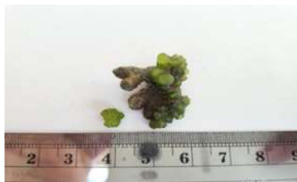
Gambar 11. Dictyosphaerica cavernosa (Forsskål) Børgesen, 1932