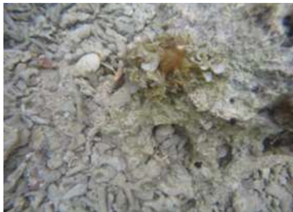
Gambar 6. Padina tetrastomatica Hauck, 1887