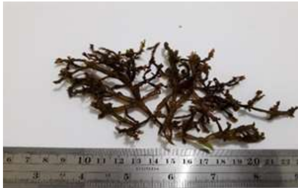
Gambar 5. Glaciliaria salicornia (C. Agardh) E.Y. Dawson, 1954

2003), dan Teluk Luwuk (Rogi, 2003). Adapun distribusi di Asia yaitu Jepang (Arasaki, 1918), Singapura (Wei dan Chin, 1983), Malaysia (Ismail, 1995), Thailand (Lewmanomont dan Ogawa, 1995), India, Sri Lanka, Bangladesh, Burma (Silva dkk, 1996), dan Filipina (Calumpang dan Meñez, 1997; Trono, 1997).