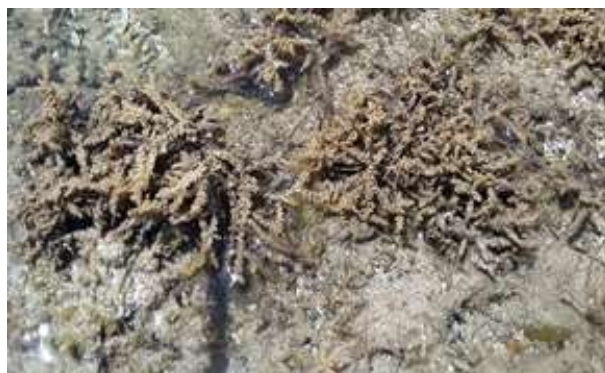
Gambar 1. Laurencia papillosa (C. Agardh) Greville, 1830