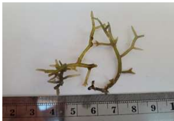
Gambar 4. Gracilaria edulis (S.G. Gmelian) P.C. Silva, 1952