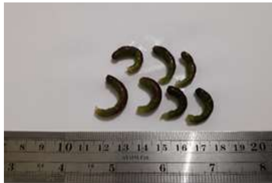
Gambar 13. Bornetella oligospora Solms-Laubach, 1892