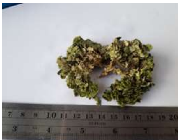
Gambar 9. Halimeda opuntia (Linnaeus) J.V. Lamoroux, 1816