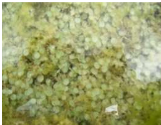
Gambar 15. Acetabularia dentata Solms-Laubach, 1895