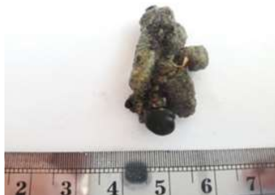
Gambar 14. Bornetella sphaerica (Zanardini) Solms-Laubach, 1892)