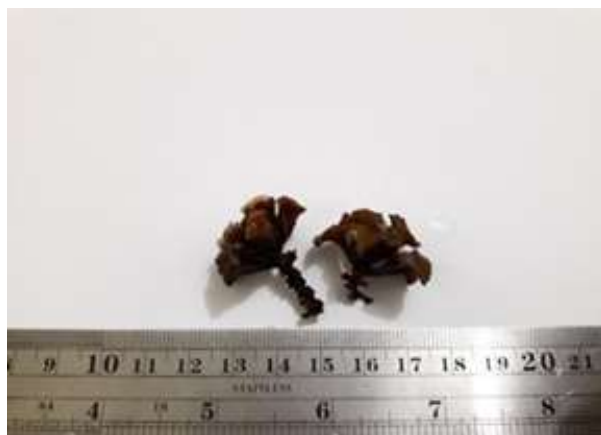
Gambar 7. Turbinaria ornata (Turner) J. Agardh, 1848