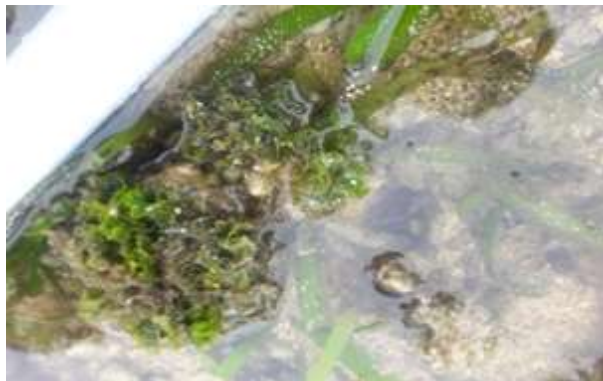
Gambar 10. Anadyomene wrightii Harvey ex J.E. Gray, 1866

Distribusi di Indonesia belum dilaporkan. Adapun distribusi di Asia yaitu India dan Srilanka (Silva dkk , 1996), Singapura (Wei dan Chin, 1983; Silva dkk , 1996).