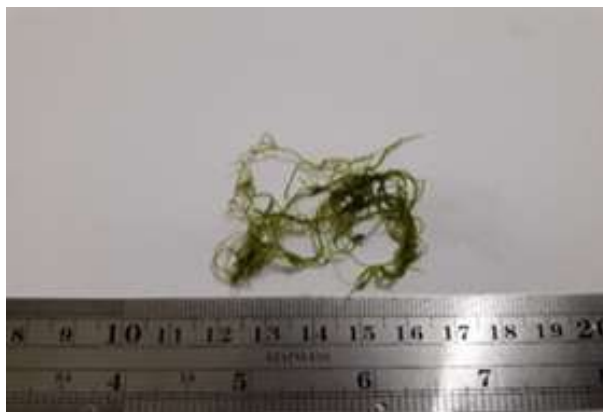
Gambar 8. Chaetomorpha crassa (C. Agardh) Kützing, 1845