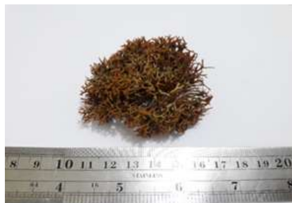
Gambar 3. Actinotrichia fragillis (Forsskål) Børgesen, 1932