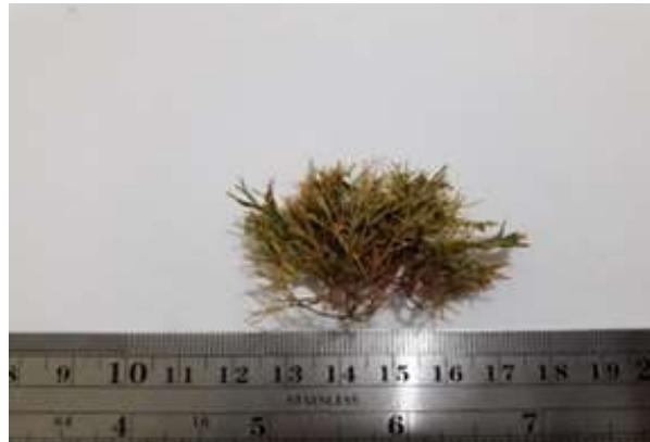
Gambar 2. Amphiroa rigida J.V. Lamouroux, 1816

Distribusi di Indonesia yaitu Pulau Aru, Makassar dan Nusakambangan, Manado (Gerung, 2001), Gorontalo (Ismail, 2002). Adapun distribusi di Asia yaitu Malaysia (Ismail, 1995), Thailand (Lewmanomout dan Ogawa, 1995), dan Filipina (Calumpong dan Meñez, 1997).