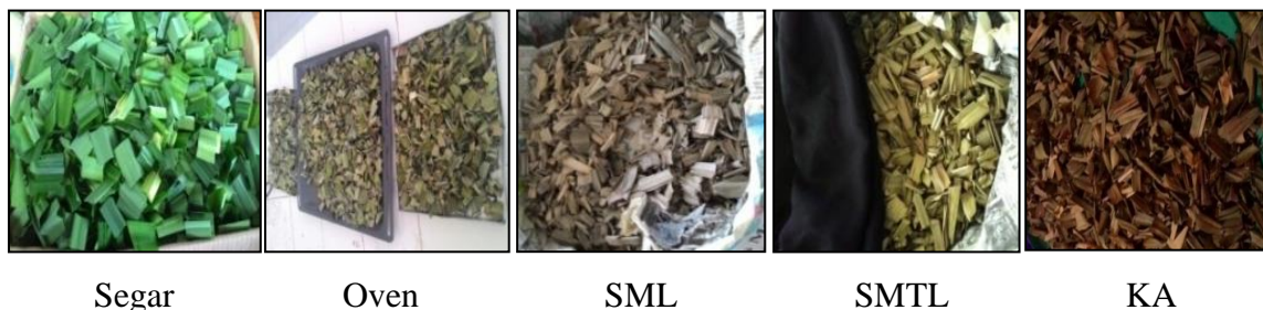
Gambar 1. Warna Kelima Sampel Daun Pandan Selama Pengeringan

Berdasarkan gambar tersebut diperoleh hasil bahwa pada sampel segar daun masih berwarna hijau segar diikuti dengan sampel oven yang berwarna hijau muda yang mulai pudar serta sampel SMTL berwarna hijau kekuningan. Kemudian pada sampel SML warna daun yang dihasilkan berupa warna hijau mulai kecoklatan bila dibandingkan dengan sampel SMTL. Sedangkan pada sampel KA daun berwarna coklat kemerahan. Warna simplisia terlihat berbeda antara keempat perlakuan pengeringan daun pandan. Perbedaan warna tersebut dikarenakan terjadinya proses degradasi klorofil dari daun pandan. Hasil ini menunjukkan bahwa terjadi proses degradasi pigmen klorofil. Hal ini sesuai dengan penelitian Sajilata dkk, 2006 dan Gross, 1991 yang menjelaskan bahwa perubahan warna pada pigmen menunjukkan terjadinya degradasi akibat terpapar pada cahaya dengan intensitas tinggi dalam waktu yang cukup lama.