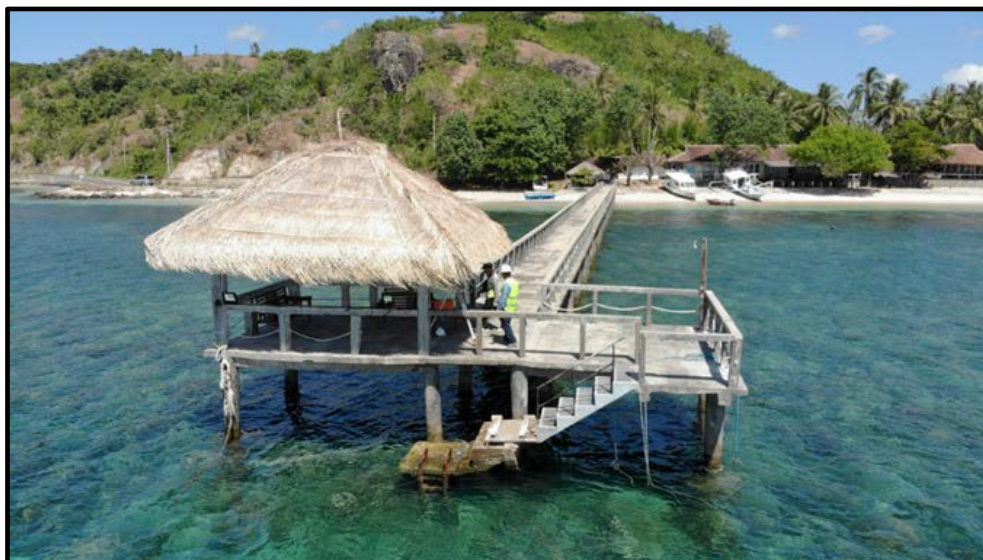
Gambar 2. Dokumentasi Survei Menggunakan Drone di Lokasi Pekerjaan Penyusunan Dokumen Studi Kelayakan Dermaga Sebagai Terminal Khusus Cocotinos Sekotong A Boutique Beach Hotel And Resort