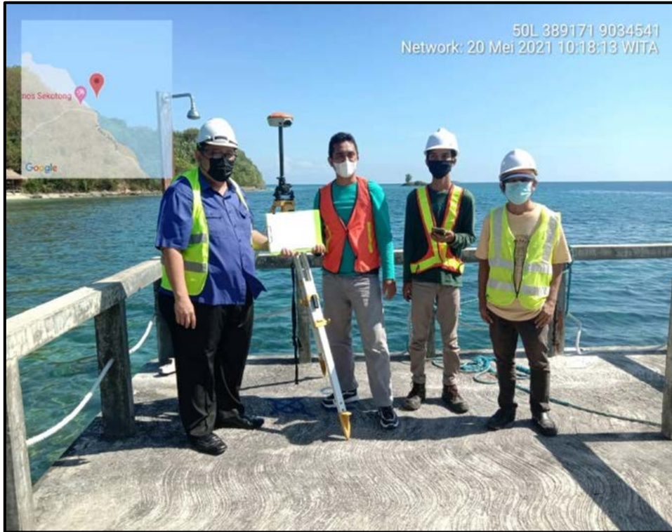
Gambar 3. Penentuan Titik ICP-1 Menggunakan alat GPS Geodetic Merk: Geofennel Type: FGS-1. Spesifikasi Dan Fitur Gps Geodetik RTK Geo Fennel FGS 1