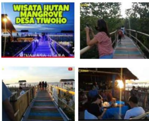
Gambar 1. Taman Wisata Hutan Mangrove Desa Tiwoho

Desa Tiwoho berada 22 Km dari Universitas Sam Ratulangi. terdiri dari 8 jaga yang dikepalai oleh ketua jaga., dengan jumlah KK sebanyak 403 KK dan tiap KK beranggotakan 4-6 orang. Penduduk di desa Tiwoho sebanyak 30% berprofesi sebagai petani, 30% sebagai nelayan, 20% sebagai tukang bangunan, 15% sebagai pedagang dan 5% adalah pegawai. Petani, nelayan dan tukang bangunan umumnya merupakan profesi kaum bapak, sedangkan pedagang dan pegawai yang hanya sebagian kecil merupakan profesi kaum ibu. Jumlah ibu-ibu yang produktif \pm 75\% , dan berperan sebagai ibu Rumah Tangga (RT). Desa Tiwoho memiliki 4 gedung gereja, 1 gedung Mesjid, 2 gedung SD, 1 gedung SMP dan 1 gedung Puskesmas. Desa Tiwoho juga memiliki taman wisata hutan mangrove yang dilengkapi dengan trail , dermaga, dan kantin yang dapat dilihat pada Gambar 1.