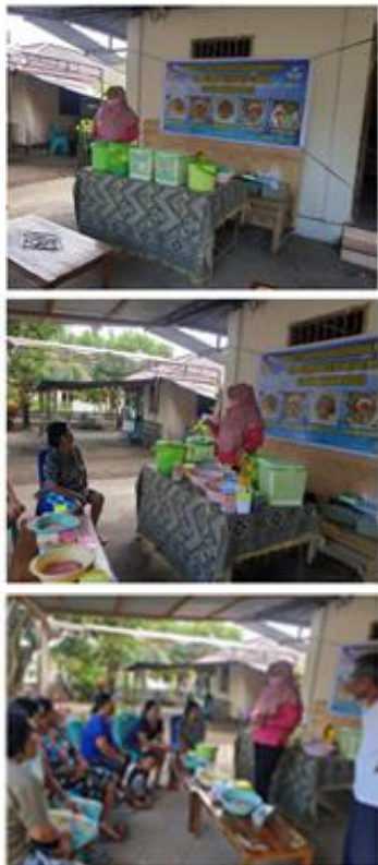
Gambar 5. Kegiatan Penyuluhan

Kegiatan penyuluhan bagi ibu-ibu kelompok Lestari Desa Tiwoho, dapat dilihat pada Gambar 5.