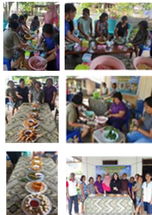
Gambar 6. Kegiatan Pelatihan dan Pendampingan

Kegiatan pelatihan dan pendampingan berlangsung dengan aman, lancar dan sukses, hal ini dapat dilihat dengan antusiasme ibu-ibu saat dilakukan pelatihan. Menurut mereka dalam pelatihan ini mereka mendapat ilmu baru yang dapat dijadikan bisnis RT terutama nuget panggang berbahan mangrove yang diharapkan akan menjadi ikon desa Tiwoho yang terkenal dengan hutan mangrove Gambar 6.