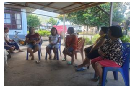
Gambar 2. Kelompok Mitra Lestari

Mitra kegiatan PKM ini adalah kelompok sosial Lestari yang anggotanya terdiri atas ibu-ibu rumah tangga yang berjumlah 10 orang dan masih tergolong usia produktif (Gambar ).