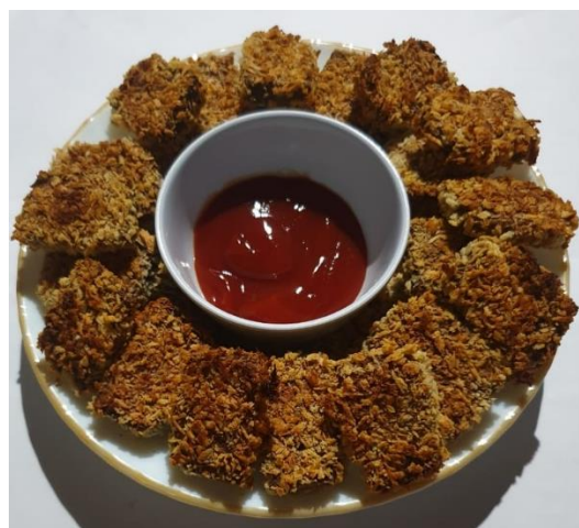
Gambar 4. Nuget Ikan Panggang Berbahan Dasar Mangrove sebagai Makanan Eksotis

Disisi lain pembuatan nugget ikan panggang berbahan dasar mangrove dan ikan adalah sama dengan nugget ikan hanya 15% tepung tapioka diganti dengan tepung buah mangrove S.alba . Selanjutnya produk dilumuri dengan tepung roti tetapi tidak digoreng tetapi dipanggang di oven sampai warna kuning kecoklatan yang menarik. Nugget ikan panggang berbahan dasar mangrove dan ikan dapat dilihat pada Gambar 4.