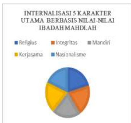
Gambar 5 Internalisasi 5 karater utama berbasis nilai-nilai ibadah

Adapun jika dikateorikan menjadi 5 karakter utama, yakni Religius, integritas, mandiri, kerjasama, dan nasionalisme tampak pada gambar berikut.