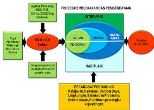
Gambar 2. Skema Proses Pembudayaan dan Pemberdayaan Pendidikan Karakter (Susanto, 2012)

Secara lebih jelas proses pembiasaan dan pembudayaan pendidikan karakter di sekolah dapat disajikan pada gambar di bawah ini.