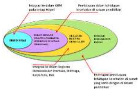
Gambar 3 Skema Strategi Mikro Pembiasaan Pendidikan Karakter di Sekolah (Susanto, 2012)

Dari gambar di atas, sangatlah jelas pembiasaan itu dilakukan mulai dari sekolah, keluarga dan masyarakat. Hal ini akan berlangsung dengan baik dengan dukungan kebijakan pemerintah dan stakeholder lainnya.