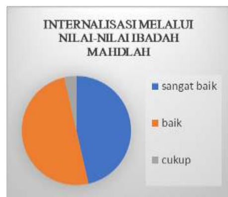
Gambar 4. Kegiatan Internalisasi

Setelah melakukan diskusi dan pendampingan, para peserta mengisi angket yang telah disediakan. Data yang diperoleh sebagai berikut.