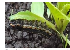
Gambar 2. Ulat grayak ( Spodoptera litura )