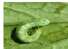
Gambar 1. Ulat tritip ( Plutella xylostella )

Hama yang ditemukan selama penelitian yaitu ulat tritip ( Plutella xylostella ) dan ulat grayak ( Spodoptera litura ) dapat dilihat pada Gambar 1 dan Gambar 2. Hama ini ditemukan pada pengamatan saat tanaman berumur 14 HST (hari sesudah tanam). Ulat tritip dan ulat grayak menyerang tanaman sawi dengan cara memakan daun hingga daun tampak berlubang (Gambar 3).