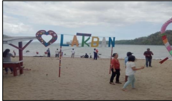
Gambar 2. Pantai Lakban