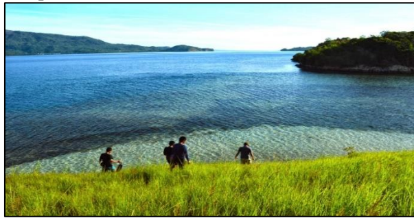
Gambar 9. Pulau Naga (Penulis, 2020)

Objek wisata pulau Naga (Dakokayu) berada di Desa Ratatotok Timur Kecamatan Ratatotok, pulau ini disuguhkan dengan hamparan rumput yang hijau dan birunya air laut yang dikelilingi hamparan pasir putih.