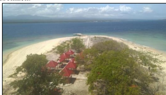
Gambar 7. Pulau Punten (Penulis, 2020)

Pasir yang putih mengelilingi pulau dengan bebatuan kecil ditambah lagi dengan keindahan bawah laut semakin menarik keindahan pulau. Pulau Punten terletak di Desa Minanga Kecamatan Pusomaen.