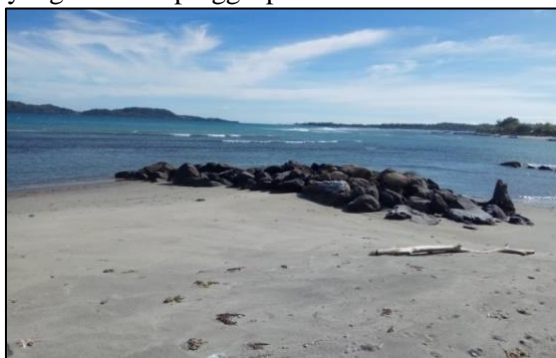
Gambar 6. Pantai Bentenan

Pantai Bentenan terletak di Kecamatan Pusomaen Desa Bentenan, potensi dari pantai ini dimana mempunyai garis pantai yang begitu panjang ditambah pasir putih kecoklatan juga terdapat batu-batu besar yang berda di pinggir pantai.