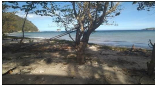
Gambar 3. Pantai Pasir Panjang (Penulis, 2020)

Pantai ini termasuk salah satu pantai yang memiliki potensi wisata bahari dimana berlokasi di Kecamatan Ratatotok, potensinya dimana mempunyai pasir putih serta garis pantai yang panjang.