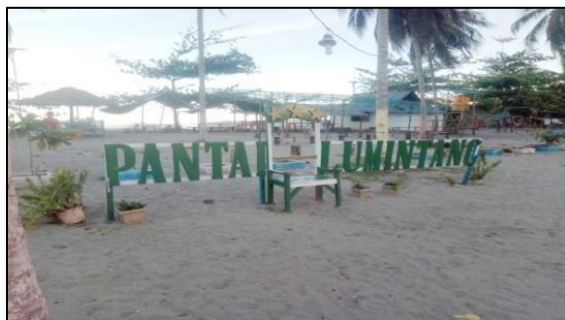
Gambar 5. Pantai Lumintang

Pantai Lumintang termasuk salah satu pantai paling sering dikunjungi wisatawan, hamparan pasir putih begitu mempesona dan juga disuguhkan dengan panorama pulau-pulau kecil yang indah.