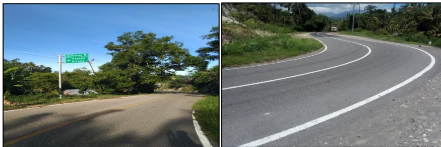
Gambar 10. Sampel Jalur Akseibilitas

Akseibilitas menuju lokasi wisata bahari yang berada di Kabupaten Minahasa Tenggara menggunakan moda transportasi darat baik itu beroda dua maupun beroda empat. Wisatawan juga bisa memilih menggunakan alat transportasi pribadi ataupun transportasi umum tergantung kenyamanan wisatawan.