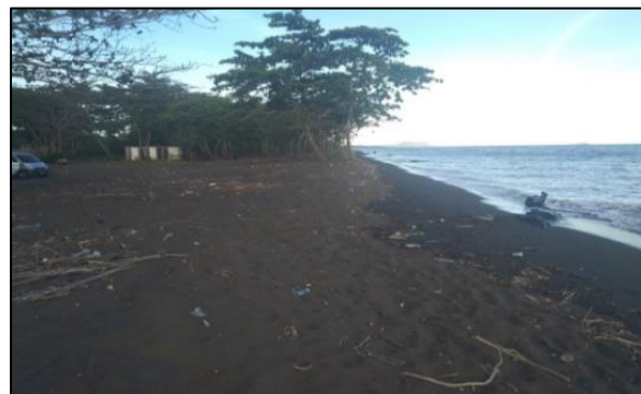
Gambar 4. Pantai Pasir Panjang (Penulis, 2020)

Pantai Hais terletak di Desa Watulney Kecamatan Belanng, pantai ini identik dengan pasir pantai yang hitam.