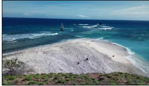
Gambar 8. Baling-Baling (Penulis, 2020)