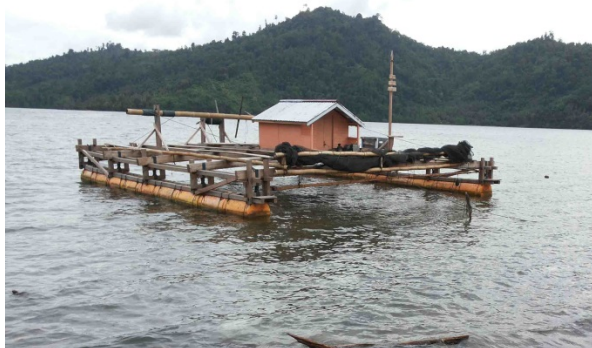
Gambar 1. Karamba jaring apung (KJA) pada rakit dan posisinya setelah dipasang di laut