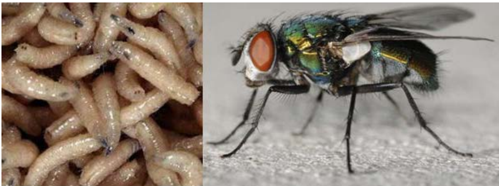
Gambar 1. Phaenicia (Lucilia) sericata . A, Larva. B, Serangga dewasa.

Larva yang akan digunakan untuk terapi larva harus steril (bebas bakteri) untuk mencegah terjadinya kontaminasi saat diaplikasikan pada luka. Larva diperlihara pada lingkungan yang lembab dan steril untuk mendapatkan larva yang medical grade . 5,11 Telur dicuci dengan larutan antiseptik dan ditempatkan di dalam wadah steril yang berisi brewer's yeast dan kedelai sebagai sumber makanan agar larva tetap bertahan hidup sampai dapat ditranspor dalam wadah steril untuk kebutuhan terapi larva. 11