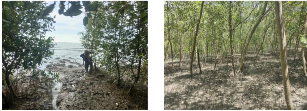
Gambar 2. Karakteristik hutan mangrove di lokasi kajian.