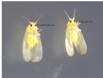
Gambar 2. B. tabaci Famili Aleyrodidae

penyakit virus tanaman seperti “ tomato leaf-curl ” virus pada tanaman tomat di Jepang (Oshima 1979).