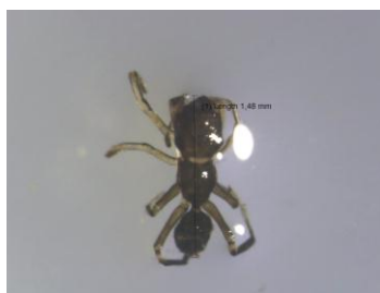
Gambar 7. Famili Formicidae

mata majemuk (Gambar 7). Serangga ini merupakan predator pada serangga-serangga lainnya serta merupakan hama pada tanaman, beberapa memakan jamur dan banyak makan cairan tumbuh-tumbuhan (Borror dkk. , (1992)).