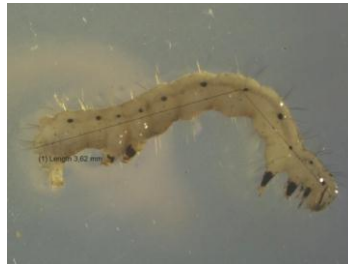
Gambar 9. Chrysodeixis chalcites Famili Noctuidae

pemakan tanaman, baik daun, batang, bunga maupun pucuk. Beberapa spesies sebagai penggerek batang dan buah.