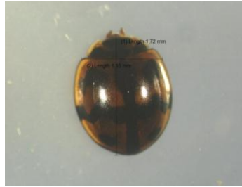
Gambar 12. Epilachna. sp Famili Coccinellidae