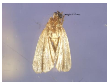
Gambar 8. Diaphania indica Famili Pyralidae

pasang sayap, sayap depan memanjang dan berbentuk segitiga, sedangkan sayap belakang lebar (Gambar 8). Salah satu spesies dari Famili Pyralidae merupakan salah satu hama serius pada pertanaman mentimun di Asia dan Afrika (MacLeod 2005), seperti D. indica . Serangga ini juga menyerang mentimun di Indonesia (Asikin, 2004).