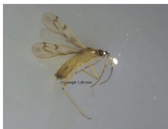
Gambar 3. N. tenuis Famili Miridae

spesies dari famili Miridae merupakan pemakan tumbuh-tumbuhan, tetapi ada juga beberapa spesies bersifat pemangsa serangga lain, misalnya N. tenuis . Kepik, N. tenuis merupakan serangga yang berstatus ganda yaitu sebagai hama dan predator (Arno et al., 2010; Calvo, et al., 2008).