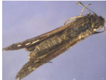
Gambar 11. Serangga E. thrax Famili Hesperidae

Noctuidae ( Chrysodeixis chalcites ). Famili Hesperidae berjumlah 1 ekor dengan rata-rata 0,25 ekor (Tabel 3). Hasil pengamatan yang dilakukan menunjukkan serangga ini memiliki ciri-ciri yaitu :