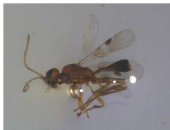
Gambar 6. Famili Ichneumonidae

ciri yaitu : tubuh berwarna orange, antena seperti rambut dengan 16 ruas, memiliki mata majemuk (Gambar 6). Serangga ini merupakan parasit bagi serangga-serangga lain atau hewan-hewan invertebrata lainnya (Borror dkk. , (1992).