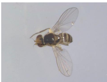
Gambar 4. L. sativae Famili Agromyzidae

hortikultura seperti kentang, kubis, bawang-bawangan, seledri, mentimun, tomat dan lain lain (Rauf 2005).