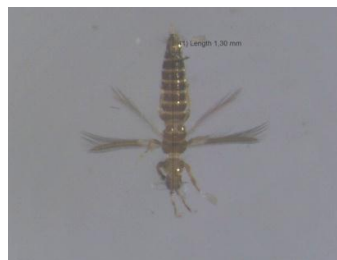
Gambar 10. Thrips tabaci Famili Thripidae

berduri, mata majemuk, antena 6-9 ruas (Gambar 10). Serangga dari Famili ini merupakan serangga pemakan tumbuh-tumbuhan, dan banyak spesies dari famili ini adalah sebagai hama yang merusak tanaman budidaya (Borror dkk , 1992).