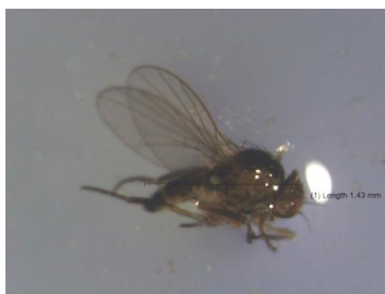
Gambar 5. Famili Dolichopodidae

memiliki antena, 3 pasang tungkai (Gambar 5). Salah satu spesies dari famili ini merupakan predator yang berpotensi sebagai musuh alami B. tabaci pada tanaman cabai (Udiarto, 2012).