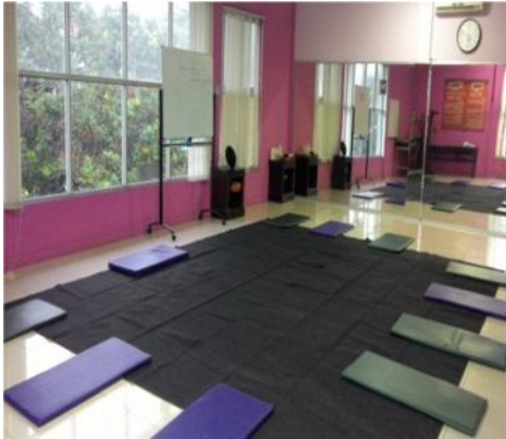
Gambar 3. Metode Primary

Ditujukan untuk stabilitasi suasana mental dan emosional penderita, sehingga gangguan jiwa yang menyebabkan perbuatan penyalahgunaan narkoba dapat diatasi. Pada tahap ini digunakan metode primary. Metode ini ditujukan dengan melakukan sosialisasi untuk pengembangan diri, serta meningkatkan kepekaan psikologis dengan melakukan berbagai program aktivitas dan terapi.