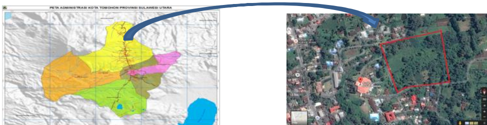
Gambar 1. Tapak Terpilih

Sesuai dengan judul dan tema dari “Pusat Rehabilitasi NAPZA” ini, maka lokasi perancangan terletak di kota Tomohon Provinsi Sulawesi Utara. Terdapat 3 alternatif tapak, lokasi terpilih berdasarkan kriteria pemilihan lokasi/tapak yaitu alternatif 1 site berada pada kawasan Kakaskasen 2, tepatnya di belakang Auditorium Bukit Inspirasi. Tapak memiliki luas/dimensi 3,5 Ha.