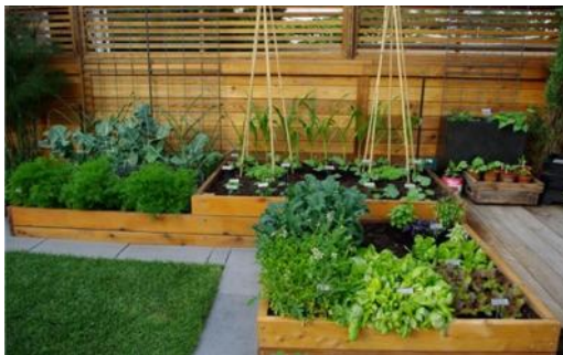
Gambar 4. Kegiatan Berkebun

Ditujukan untuk pemulihan keberfungsian fisik, mental, dan sosial penderita. Seperti belajar, bekerja, serta bergaul, sudah mendapatkan kebebasan yang lebih namun tetap mengikuti kegiatan kelompok karena masih menjadi anggota keluarga dalam kelompoknya.