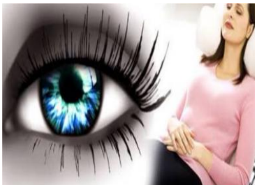
Gambar 2. Tahap Induction

Adalah terapi lepas narkoba, dan terapi fisik yang ditujukan untuk menurunkan dan menghilangkan racun dari tubuh Metode ini adalah tahap awal sebelum para pecandu dapat bergabung menjadi sebuah keluarga. Pengurangan selama tiga bulan di sel menjadi inti tahapan induction ini