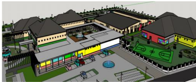
Gambar 6. Perspektif

Ruang-ruang terbagi atas ruang terapi, ruang isolasi, ruang perawatan pasien serta fasilitas penunjang. Dimana massa untuk ruang perawatan pasien berupa kamar dengan selasar dengan konsep berupa massa jamak. Untuk ruang isolasi menggunakan material yang bersifat lunak agar tidak melukai diri mereka disaat mereka sedang mengalami sakaw, akan tetapi tidak membatasi akses indera mereka. Ruang terapi dimana kesan yang ingin ditimbulkan adalah rehabilitasi seperti berada di tempat yang ramah, dan menyenangkan layaknya rumah sendiri. Sedangkan untuk