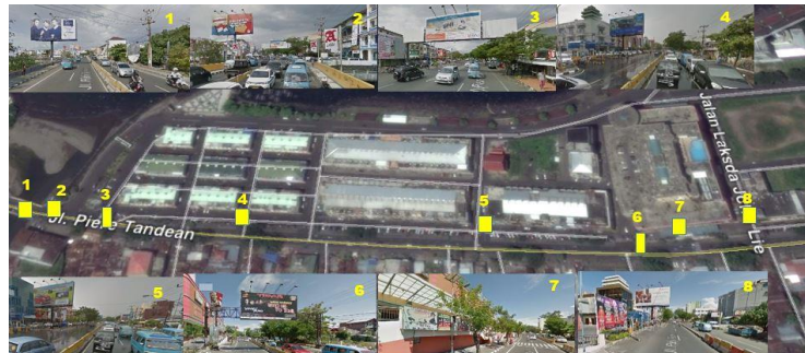
Gambar 5. Eksisting papan reklame segmen 3

Kawasan MTC, berikut merupakan visualisasi perletakan papan reklame segmen 3