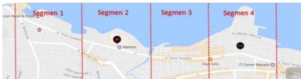
Gambar 1. Pembagian segmen