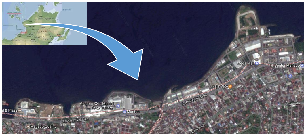
Gambar 2. Peta Lokasi Perancangan

Lokasi penelitian mencakup Koridor Bolevard on Bussiness (BoB) jalan Piere Tendeau kota Manado dan masuk wilayah administrasi Kecamatan Wenang tepatnya Kelurahan Sario Tumpaan, Kelurahan Sario Utara, Kelurahan Titiwungan Selatan, Kelurahan Titiwungen Utara, Kelurahan Wenang Selatan dan Kelurahan Wenang Utara seperti pada gambar 1. Dengan batas-batasnya sebagai berikut: