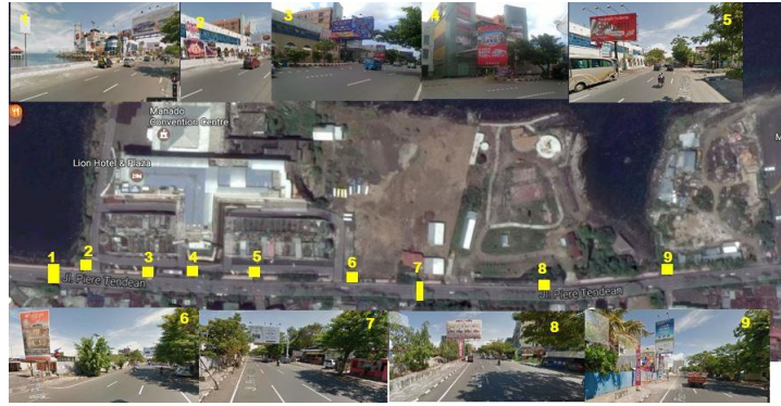
Gambar 3. Eksisting papan reklame segmen 1

Kawasan Boulevard mall, berikut merupakan visualisasi perletakan papan reklame segmen 1