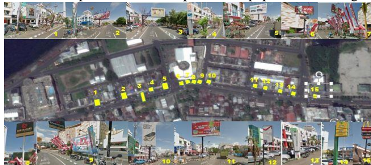
Gambar 6. Eksisting papan reklame segmen 4

Kawasan Mantos, berikut merupakan visualisasi perletakan papan reklame segmen 2