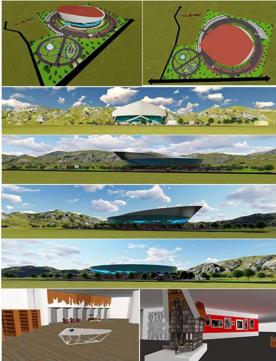
Gambar : Hasil Perancangan

Pembahasan bab ini merujuk pada hasil-hasil proses perancangan yang dikaji melalui pendekatan kajian objek, pendekatan kajian tapak dan lingkungan serta melalui pendekatan tematik, yaitu Semiotika dalam Arsitektur .