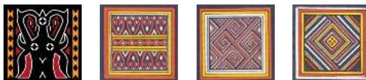
Gambar : Ornamen Ukiran Toraja