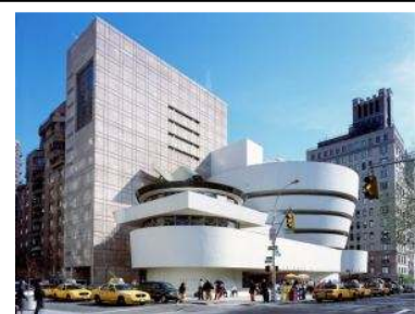
Gambar 8. Guggenheim

Bangunan ini menerapkan konsep "Arsitektur organik", dimana ruang dan bentuk terpadu. Potongan dan pandangan dari luar secara bersamaan menyatu secara meyakinkan dalam bentuk tiga dimensional dan ruang, diwujudkan dalam konstruksi beton spiral. Pada puncak spiral terdapat kubah kaca yang menerangi semua ruangan secara alami. Ciri Arsitektur organik yaitu diilhami dari alam, membiarkan desain apa adanya, membenteng pada suatu organisme, mengikuti arus dan menyesuaikan diri, mencukupi kebutuhan sosial fisik dan rohani, tumbuh keluar dan unik, menandai jiwa muda dan kesenangan, mengikuti irama.