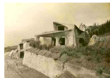
Gambar 5. Housing Project Sumber: www.google.com Kata kunci: 'Housing Project'. 2011

Selain itu Bangunan ini dalam perancangannya seperti yang terlihat pada gambar bentuk bangunannya mengandung nilai kebebasan bentuk dan garis, serta bentuknya tidak monoton.