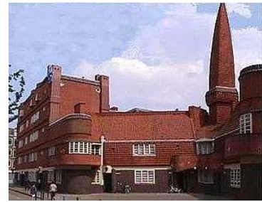
Gambar 6. Sekolah Amsterdam

Pada bangunan ini unsur ekspresionisnya terletak pada bentuk bangunan yang menggunakan material berupa batu bata. Ciri ekspresionisnya yaitu berupa material batu bata yang ditonjolkan yang disusun sedemikian rupa secara teratur dan membentuk ruang, pada bangunan ini bentuk batanya disusun tidak hanya berbentuk kotak namun ada yang berbentuk lengkung hingga hal tersebut membuat bangunan sekolah amsterdam ini terlihat sangat indah/berestetika. Keindahan tersebut juga dapat menunjukkan adanya ciri dari Seni Arsitektur Ekspresionis.