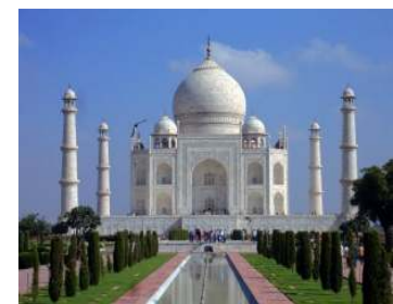
Gambar 7. Taj Mahal

Pada bangunan ini ciri Ekspresionisnya terletak pada gaya/aliran dari bangunan tersebut yaitu aliran Romantik. Aliran Romantik disini adalah mengenai suatu konsep dalam perancangan sebuah bangunan Arsitektur dengan mengedepankan nilai-nilai estetika yang dapat menjadi sebuah kesan yang menarik dan mewakili nilai sejarah. Dengan ciri-ciri yaitu gaya aliran ini melibatkan emosi/perasaan seorang perancang yang cenderung memilih gaya rancangan yang disukainya saja; mengekspresikan pergolakan suasana hati; dan kehendak seorang perancang untuk menjelajahi ke dalam keinginan manusia, yang diyakini akan menghasilkan suatu rancangan yang ideal dan harmonis.