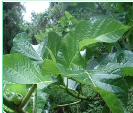
Gambar 1. Daun Ficus septica Burm.F