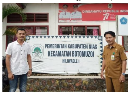
Kantor Kecamatan Botomuzoi Kabupaten Nias, Sumatera Utara